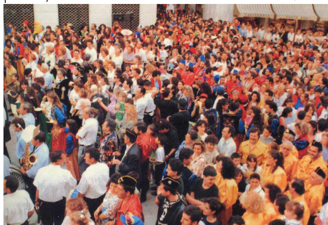
Plaza de la Constitución, jueves 6 de junio de 1991, momentos previos a cantar por primera vez el pasodoble Idella.

Hoy la música y letra, tras 29 años consecutivos, se ha convertido en una pieza insustituible en el arranque de la fiesta de Moros y Cristianos. Niños, jóvenes, adultos y veteranos de la Fiesta; amigos, colegas, parejas y escuadras completas entonan al unísono una letra al son de una música convertida en el himno de nuestra fiesta . Himno euforizante que hace vibrar a todos los eldenses bajo un mismo sentimiento de unión ante el destino conjunto, convirtiéndose en uno, o quizás el más potente, elemento de cohesión de nuestra ciudad.