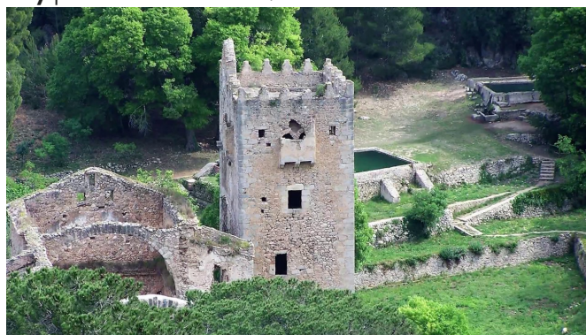
Ruinas del monasterio jerónimo de Santa María de la Murta (Alcira) en el que se firmó la compraventa del señorío de Elda un 4 de septiembre de 1513.