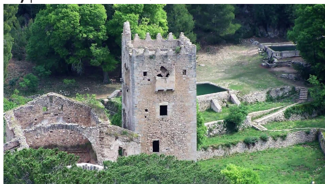
Ruinas del monasterio jerónimo de Santa María de la Murta (Alcira) en el que se firmó la compraventa del señorío de Elda un 4 de septiembre de 1513.