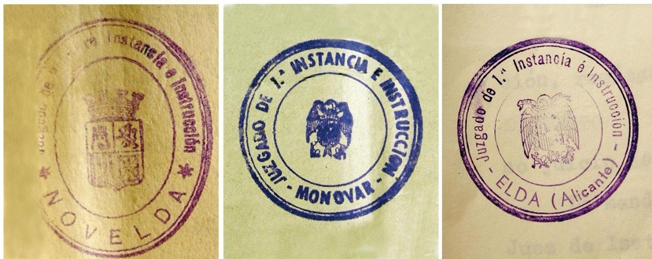
Sellos de los juzgados agrupados en el Juzgado de Primera Instancia e Instrucción de Elda.

Tras los primeros años de posguerra, llenos de carestía, hambre, represión y miedo, la industrial Elda inició su despegue económico e industrial a partir de la llegada a la alcaldía de José Martínez González, conocido popularmente como “el Aragonés”. Desarrollo mantenido ininterrumpidamente durante 45 años (1945-1990), periodo en el cual la ciudad creció un 187,39 %, pasando de los 20.013 habitantes (1945) a los 57.515 habitantes en 1990. Fulgurante crecimiento demográfico que fue acompañado del consiguiente desarrollo urbanístico. Elda crecía sin parar, año tras año, década tras década, a un ritmo un tanto vertiginoso. Aquel desarrollo se aceleró a partir de 1955 y en especial a partir de la creación de la Feria Internacional del Calzado, alcanzándose niveles excepcionales de hasta 8.701 nuevos eldenses en tan solo 5 años (1965-1970), es decir, una media de 1.740 habitantes por año.