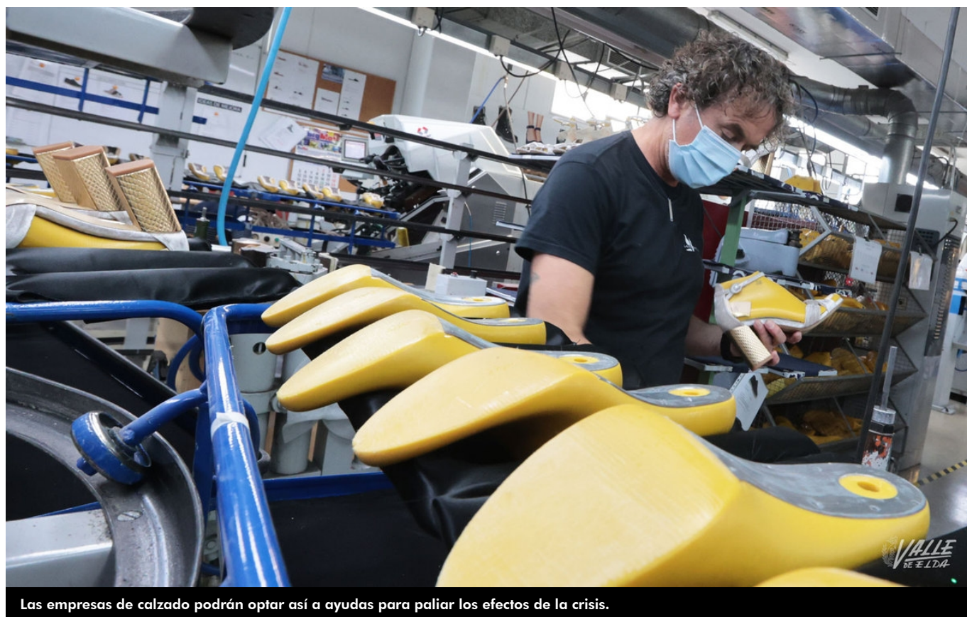
Las empresas de calzado podrán optar así a ayudas para paliar los efectos de la crisis.

El Consejo de Ministros ha aprobado una modificación del Real Decreto-ley 5/2021 de medidas extraordinarias de apoyo a la solvencia empresarial en respuesta a la pandemia de la COVID-19 , por la que se permite a las Comunidades Autónomas y a las ciudades de Ceuta y Melilla ampliar los sectores y empresas que podrán beneficiarse de la línea de ayudas directas a autónomos y empresas dotado con 7.000 millones de euros. Esto se traduce en que las empresas del calzado y marroquinería podrán optar a las ayudas.