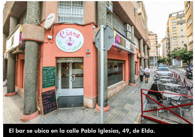
El bar se ubica en la calle Pablo Iglesias, 49, de Elda.