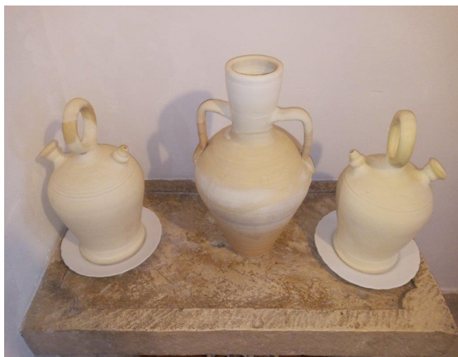
Sobre el canterer es col·locaven els recipients destinats a contenir aigua | Gabriel Segura.

El canterer era un dels llocs fonamentals i més típics de les cases i, generalment, estava situat a l'entrada d'estes. Formant part del conjunt destinat als recipients per a contenir aigua, hi havia també una gerra, amb vernís a l'interior, en les anses i alguns xorros que li queien per la part exterior, i l'aigua que contenia s'utilitzava per a guisar i per a la higiene personal.