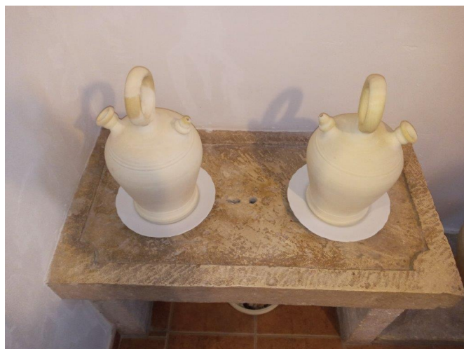
Per estos xicotets forats queia l'aigua que suaven els botijons a un altre recipient | Gabriel Segura.

Hi havia també un recipient per a llavar-se les mans; en les cases més acomodades era un llavamans de porcellana i en les més humils, un llibrell de fang.