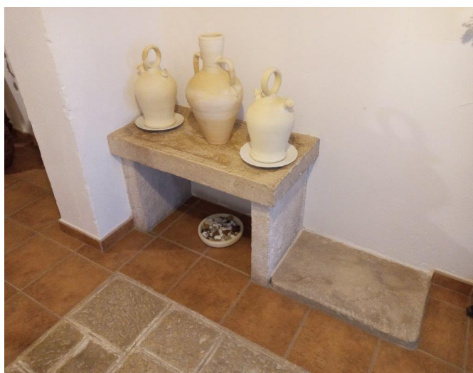
Botijons valencians i cànter | Gabriel Segura.

El canterer era un dels llocs fonamentals i més típics de les cases i, generalment, estava situat a l'entrada d'estes. Formant part del conjunt destinat als recipients per a contenir aigua, hi havia també una gerra, amb vernís a l'interior, en les anses i alguns xorros que li queien per la part exterior, i l'aigua que contenia s'utilitzava per a guisar i per a la higiene personal.