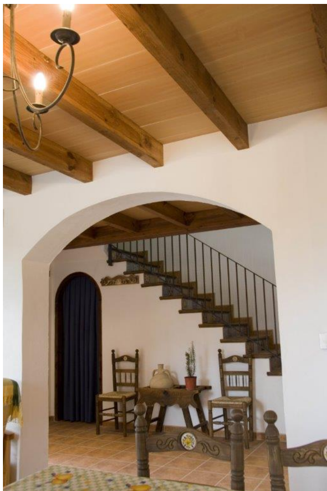
Canterer de fusta de la casa rural La Esperanza | Heliodoro Corbí.

En l'aixovar de les nòvies les peces que componien el canterer ocupaven un lloc molt important. Quan les xiques s'anaven a casar feien encàrrecs a les fàbriques de cantereries de cànTERS de mirinyac amb una rosa "brodada" en fang pintada i el seu nom brodat per a arreglar-se el canterer. Estes peces de cantereria, igual que els botijons, les gerres, orses, etc., eren fonamentals en l'aixovar de les nòvies i en els utensilis de casa.