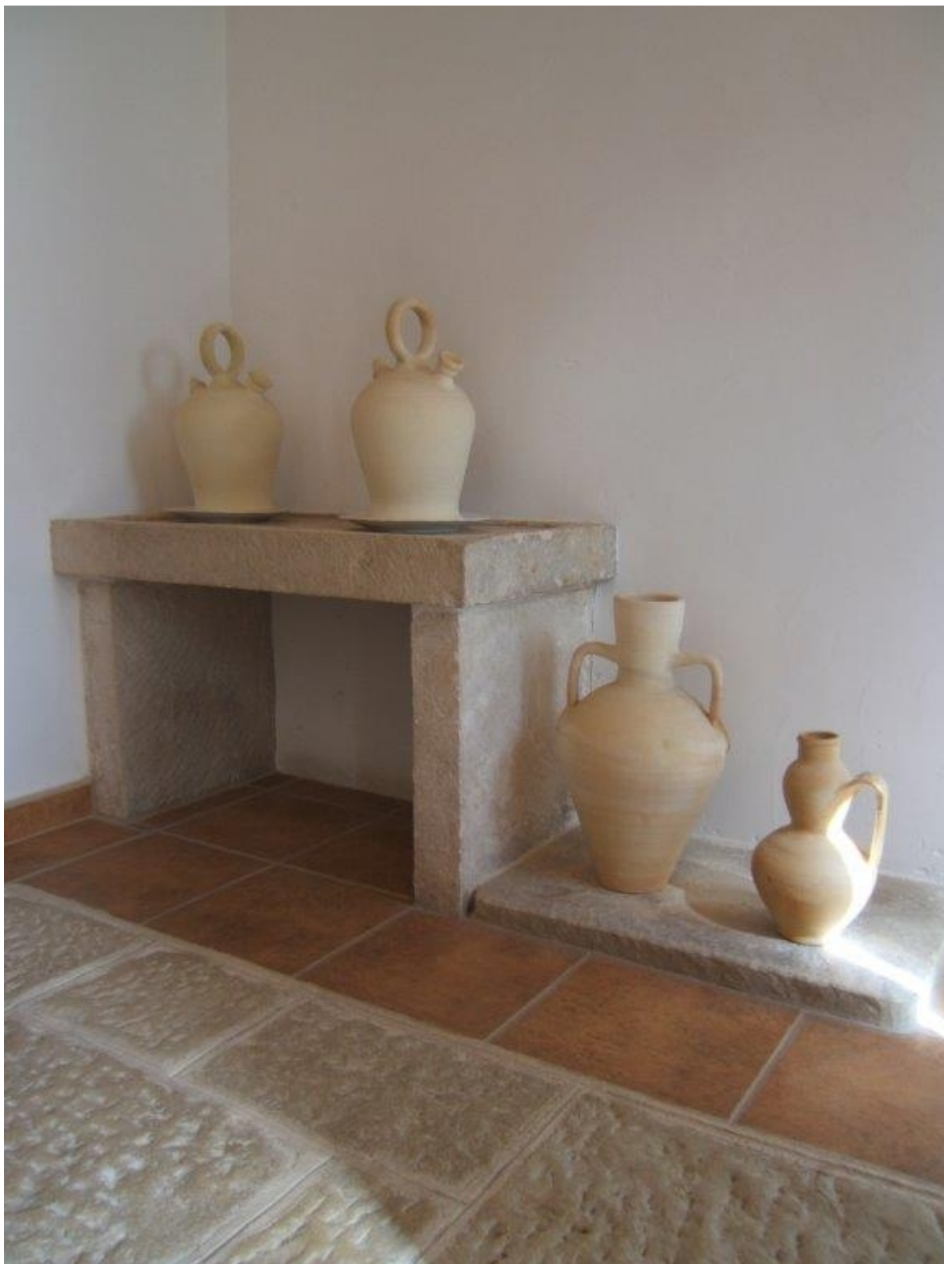
Canterer de pedra de la casa rural La Esperanza de Caprala | Gabriel Segura.