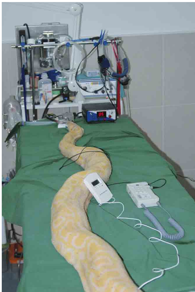
Preparación de una serpiente para cesárea: los animales anestesiados deben estar correctamente monitorizados

Es cierto que muchas especies dependen de que les proporcionemos un ambiente lo más parecido posible al que tendrían en la naturaleza y cuyo defecto puede ser motivo de enfermedad. Por esta razón, antes de adquirir un animal, tanto si es un perro o gato como si es un exótico, deberíamos plantearnos si vamos a ser capaces de proporcionar el ambiente adecuado a ese animal. Es cierto también que cuanto más pequeño es un animal, más complicado resulta el poder realizar procedimientos clínicos que nos lleven a un diagnóstico correcto y consecuentemente a un tratamiento adecuado.