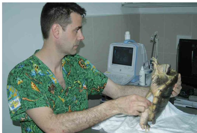
Ecografía en una tortuga para valorar un problema relacionado con la puesta de huevos.

Si aceptamos al animal como la especie a la que pertenece, trataremos de proporcionarle todo lo que la naturaleza le daría para cubrirse todas sus necesidades y le ofrecemos la protección adecuada frente a depredadores y enfermedades biológicas. Mediante el manejo de su entorno y su control sanitario, tendremos mucho a favor de que su vida sea saludable. Además de la salud física-biológica, no podemos olvidarnos de la salud psíquica de nuestras mascotas. A veces, de forma inconsciente, con nuestra forma de actuar, reforzamos conductas inadecuadas en nuestras mascotas porque desconocemos y malinterpretamos lo que nos están comunicando. Los problemas psicológicos de los animales son más fáciles de prevenir que de tratar.