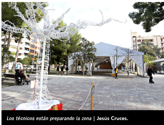
Los técnicos están preparando la zona | Jesús Cruces.

Minutos después comenzará la actuación de la agrupación Athenas , que deleitará al público desde la concha. Por otro lado, la carpa tiene capacidad para 450 personas , contará con calefactores, barras en su interior así como un puesto de churros, chocolate y castañas en el exterior.