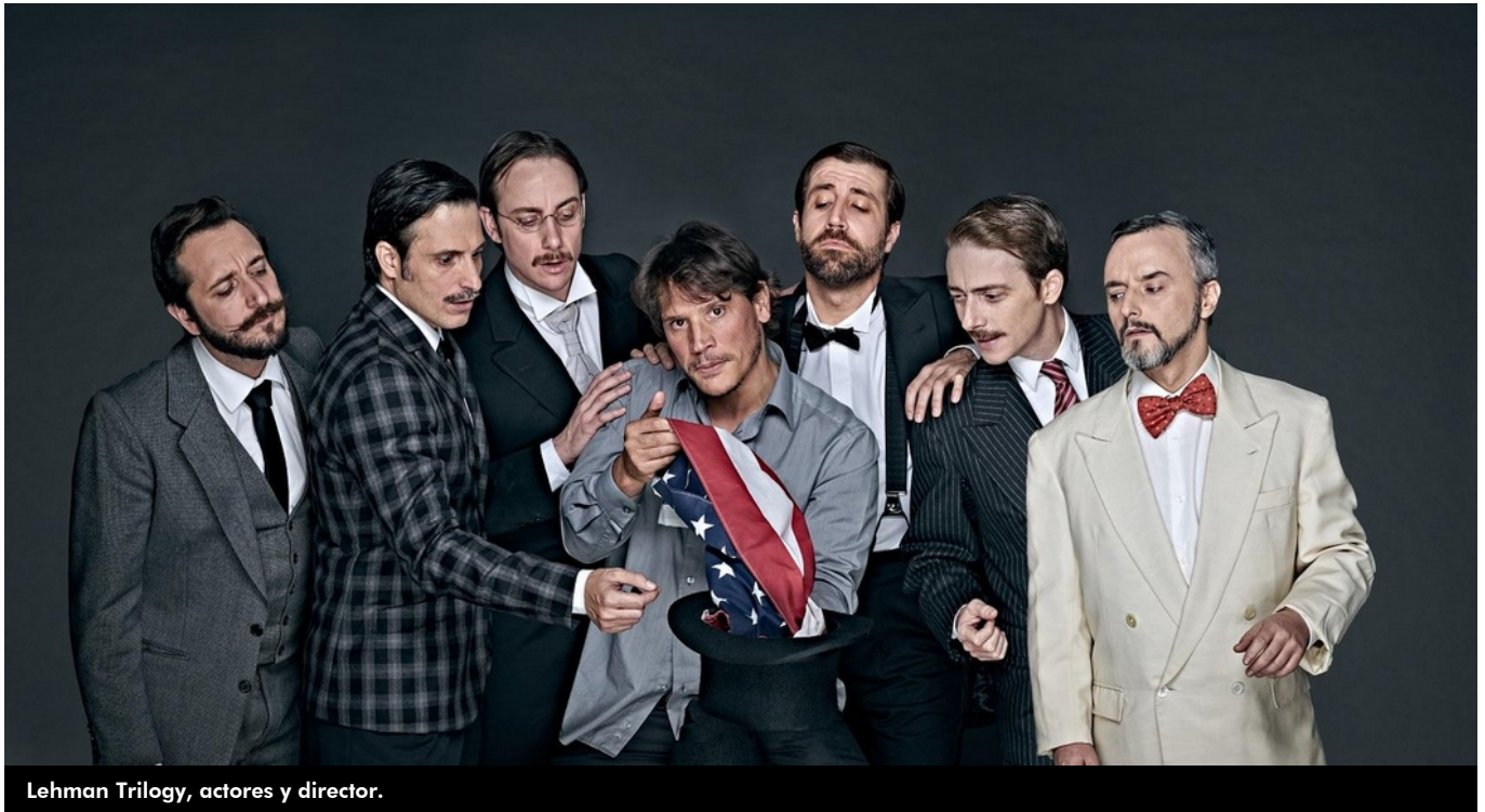
Lehman Trilogy, actores y director.

Los aficionados al teatro están de enhorabuena. En las próximas semanas la capital de la provincia acoge diversas propuestas que han recibido críticas excelentes y que se encuentran entre lo mejor que actualmente está de gira por nuestro país.