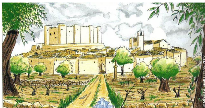
Vista panorámica de la villa de Elda a finales del siglo XVI

etc.) solían terminar con la muerte de algunos de los contendientes por el uso habitual de cuchillos, navajas y espadas que portaban los contendientes a tan temprana edad. Así, en dicha crida aparece recogida la referencia al menos 4 muertes por arma blanca en peleas juveniles. Por todo ello, y en pos del buen gobierno y la paz en la villa, Gaspar Remiro prohibió, de forma taxativa, el uso de cuchillos, navajas y espadas a los menores de 18 años. Crida o bando que el pregonero municipal , precedido por el sonido de su trompetín, debió leer en las plazas y calles de la villa para conocimiento de todos los eldenses, tanto moriscos como cristianos viejos. Normativa de convivencia ciudadana que entraba en vigor tras la lectura pública por el pregonero.