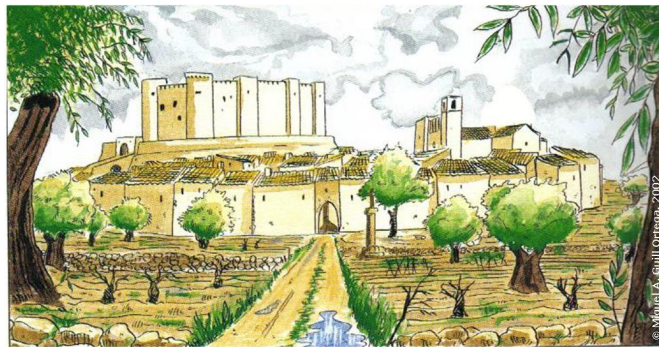
Vista panorámica de la villa de Elda a finales del siglo XVI

etc.) solían terminar con la muerte de algunos de los contendientes por el uso habitual de cuchillos, navajas y espadas que portaban los contendientes a tan temprana edad. Así, en dicha crida aparece recogida la referencia al menos 4 muertes por arma blanca en peleas juveniles. Por todo ello, y en pos del buen gobierno y la paz en la villa, Gaspar Remiro prohibió, de forma taxativa, el uso de cuchillos, navajas y espadas a los menores de 18 años. Crida o bando que el pregonero municipal , precedido por el sonido de su trompetín, debió leer en las plazas y calles de la villa para conocimiento de todos los eldenses, tanto moriscos como cristianos viejos. Normativa de convivencia ciudadana que entraba en vigor tras la lectura pública por el pregonero.