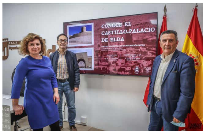
Presentación de las visitas al castillo en rueda de prensa.

A finales de junio comenzará la nueva obra para recuperar la barbacana, la intención es que este punto histórico vuelva a ser visitable en marzo de 2023.