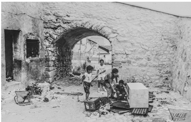
Imagen de las antiguas viviendas bajo el castillo

Estas visitas tendrán cuatro paradas. Comenzarán en el antemural, en el que se vinculará la historia del Castillo con la familia que ostentó el condado de Elda y se unirá a la vida de la ciudad ya que existían casas en esta zona. Seguidamente se hará una parada en la puerta del antemural, la restauración más reciente del monumento. La tercera pausa será frente al edificio interior y, la última, será en el patio de armas, allí los guías utilizarán imágenes para mostrar el pasado y el futuro del castillo.