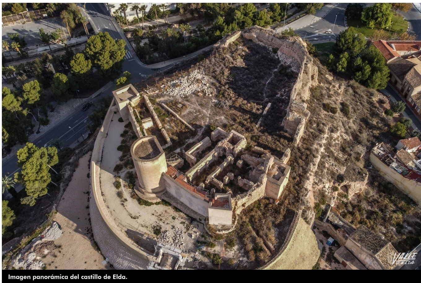
Imagen panorámica del castillo de Elda.

Los eldenses están de enhorabuena ya que podrán volver a visitar el castillo-palacio una década después . Cada fin de semana desde este mismo domingo hasta la tercera semana de junio el Ayuntamiento ha organizado visitas guiadas con inscripción previa de hasta 25 personas por grupo. En total visitarán el monumento patrimonial unas 500 personas.