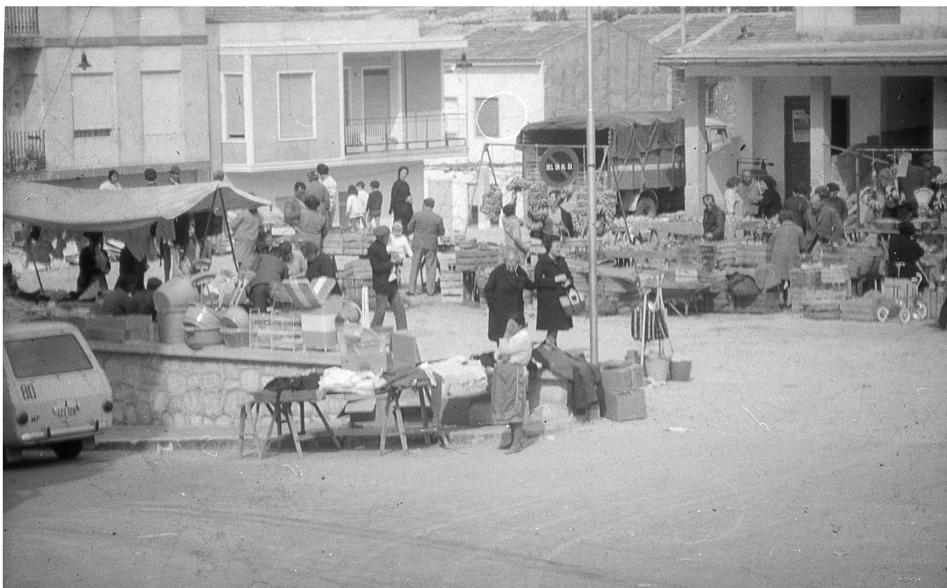
Mercadillo en los alrededores del antiguo mercado, en lo que en la actualidad es la plaza del Derrocat | José Esteve.

Podemos afirmar que desde inmemorial la venta ambulante ha sido una práctica habitual en muchos lugares de España y por supuesto también de Petrer. Puestos de todo tipo, de verduras, hortalizas y frutas se instalaban puntualmente en la zona situada delante del viejo mercado municipal en lo que en la actualidad es oficialmente la plaza del Derrocat. Además, había puestos donde se vendían melones, puestos de cascaruja, puestos de venta de productos de limpieza, de ropa para el hogar, de ropa para mujeres, de cestas, de juguetes y de pescado en la plaza de Baix. Todo tipo de objetos que podamos imaginar se vendieron desde siempre en los alrededores del mercado, extendiéndose en algunas ocasiones a la calle Cánovas del Castillo y a algún que otro punto del pueblo. Con anterioridad el mercado al aire libre se hacía en la plaza de Dalt, conocida durante