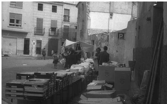
Calle Cánovas del Castillo, delante de lo que en la actualidad es el edificio Maracaibo | José Esteve.

que el pequeño comercio esté cada vez más en declive. Es tarea de todos mantener lo poco que nos queda.