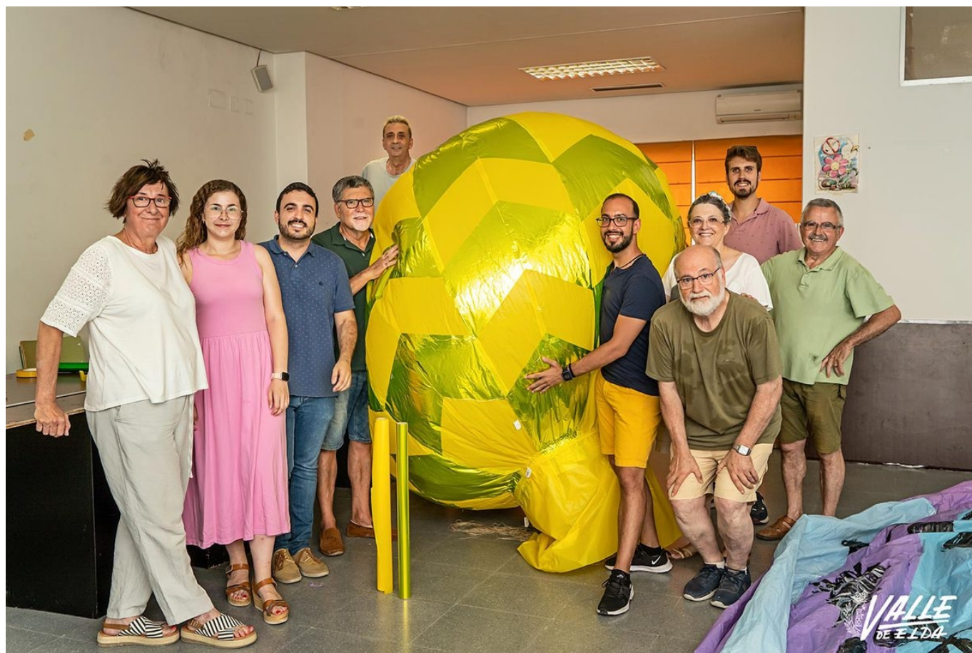
La Comisión del Globo y la Traca trabaja cada verano en poner a punto los aerostáticos | Nando Verdú.

Sin duda, la suelta de globos se ha convertido en una seña identitaria para las Fiestas Mayores de Elda , aunque se recuperaron hace poco más de una década, la población tiene una cita antes de comer los días 8 y 9, los días grandes, en la Plaza Mayor, para ver cómo dos grandes aerostáticos surcan el cielo eldense. También el día 7 muchas miradas van al cielo al anochecer para ver un globo iluminado subir hacia lo alto desde las puertas de Santa Ana.