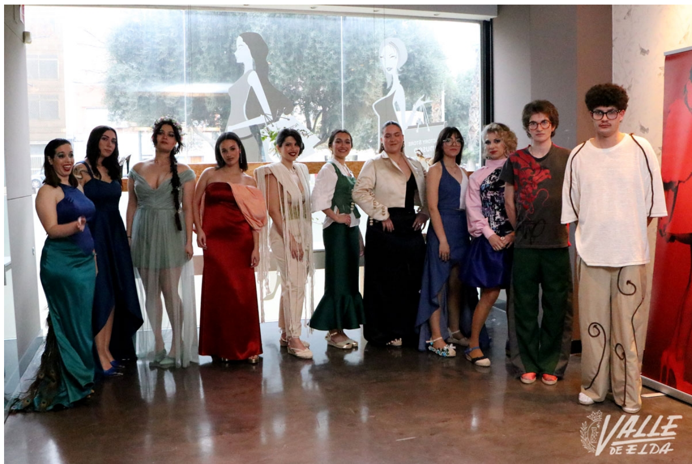
Los 13 diseños han protagonizado el desfile | Marta Maestre.

El alumnado de los grados básico, medio y superior de Calzado y del grado superior de Moda del IES La Torreta han derrochado talento, esta tarde, con un desfile de moda en el que la naturaleza ha sido protagonista en cada uno de los 13 diseños mostrados . El Museo del Calzado ha acogido, por segundo año consecutivo, este acto en el que también han colaborado alumnos de los grados de Peluquería y Maquillaje.