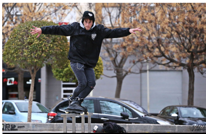
También practica trucos en barandilla