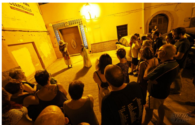
Unas 200 personas asistieron en cuatro grupos | Jesús Cruces.

Las Parras , a escasos 100 metros del Consistorio, conserva su forma desde que se crease en el siglo XIII . Uno de los personajes aprovechó la ocasión para lamentar la dejadez de los encargados del patrimonio eldense a lo largo de los siglos, pues han dejado perder gran parte del mismo y por ello propuso “apostar por el patrimonio, respetarlo y cuidarlo, que los gobernantes se sientan orgullosos de la historia eldense y la protejan” .