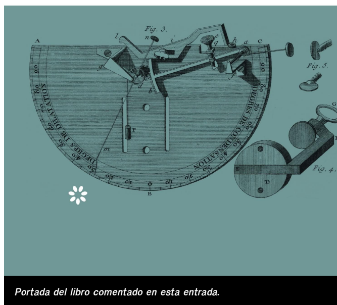
Portada del libro comentado en esta entrada.

Un ensayo sobre la espera Epílogo de Gregorio Luri