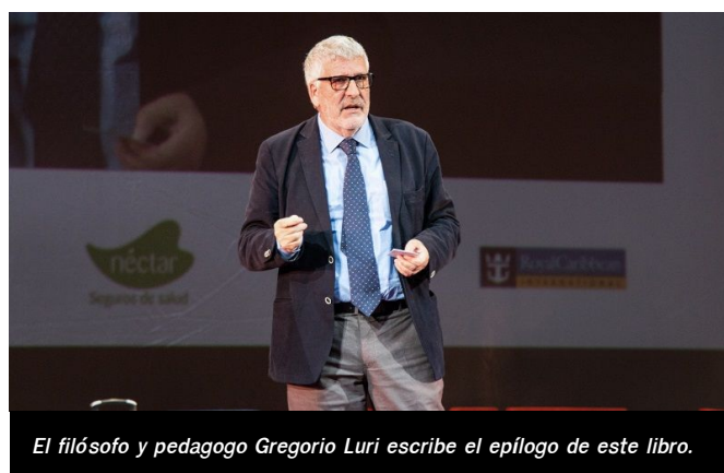
El filósofo y pedagogo Gregorio Luri escribe el epílogo de este libro.

“¿Cómo pensará la espera la inteligencia artificial en el futuro? ¿Podrá ser verdaderamente inteligente si no se siente tocada por la muerte? ¿Y si se siente tocada por la muerte, dónde encontrará consuelo? En los poshumanos no, desde luego, porque al no necesitar ya de su inteligencia podrán vacar a ser bobos y felices”.