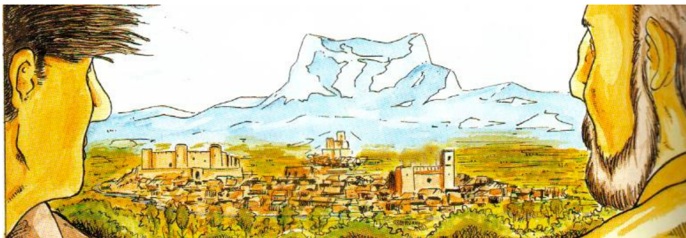
Ultima mirada al valle de Elda un domingo, 4 de octubre de 1609, antes de partir hacia el destierro

Corría el año D.N. de 1611 ; los reinos de la Españas eran regidos por S.M Felipe III , quien en 1598 había sucedido en el trono de la Monarquía Hispánica a su padre Felipe II; hacía escasos dos años que los moriscos de todo el reino de Valencia habían sido expulsados al exilio norteafricano en una operación de lo que hoy en día calificaríamos de "limpieza étnica"; y entre ellos, todos los vecinos eldenses (hombres, mujeres, niños y ancianos) que un 4 de octubre de 1609 abandonaron sus casas, sus pertenencias y la tierra que les vio nacer para ser conducidos, en las galeras comandadas por el conde de Elda, a las playas de Orán y Mostaganem , en la actual Argelia , desde donde nunca más volvieron a su Elda natal.