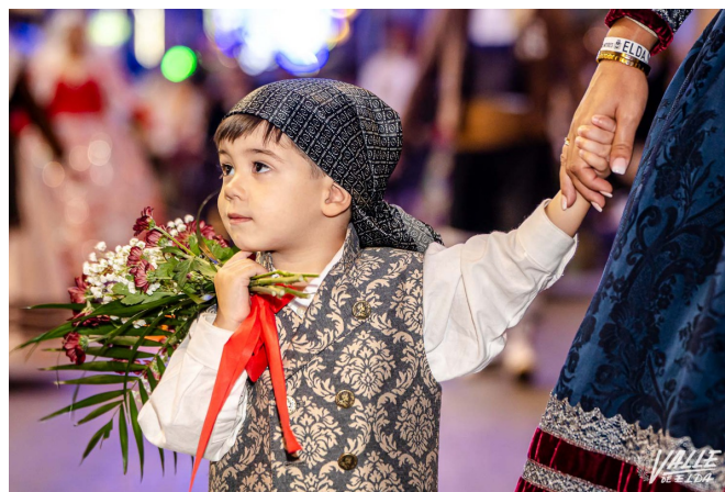
Los más pequeños constituyen una parte importante de la fiesta | Nando Verdú.

La procesión comenzará a las 19 horas desde la iglesia de Santa Ana. El punto final a las fiestas lo pondrá el fuego con la Cremà de los monumentos falleros que se iniciará a partir de las 21:45 horas, empezando por la Falla Oficial para, 15 minutos después seguir con Ronda San Pascual, Jardín de la Música y el Huerto; a las 23 horas con Trinquete, San Francisco de Sales, Zona Centro y Estación y a las 00:45 horas con José Antonio "Las 300", Fraternidad y Huerta Nueva. Este año el monumento ganador, el de Huerta Nueva, será el último en arder a medianoche.