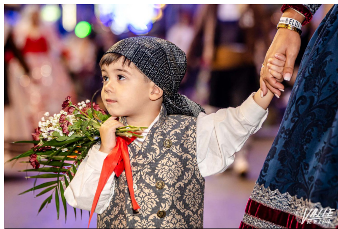
Los más pequeños constituyen una parte importante de la fiesta | Nando Verdú.

La procesión comenzará a las 19 horas desde la iglesia de Santa Ana. El punto final a las fiestas lo pondrá el fuego con la Cremà de los monumentos falleros que se iniciará a partir de las 21:45 horas, empezando por la Falla Oficial para, 15 minutos después seguir con Ronda San Pascual, Jardín de la Música y el Huerto; a las 23 horas con Trinquete, San Francisco de Sales, Zona Centro y Estación y a las 00:45 horas con José Antonio "Las 300", Fraternidad y Huerta Nueva. Este año el monumento ganador, el de Huerta Nueva, será el último en arder a medianoche.