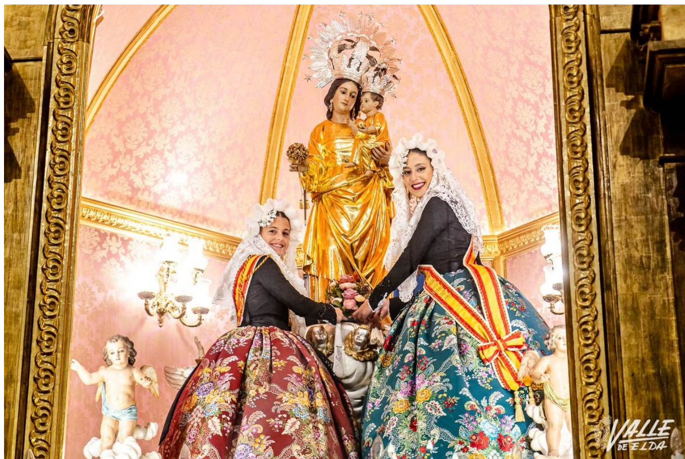
Las Falleras Mayores dejaron flores en el camarín de la Virgen de la Salud | Nando Verdú.

Los Santos Patronos de Elda, la Virgen de la Salud y el Cristo del Buen Suceso, recibieron ayer el cariño de cientos de falleros durante la Ofrenda de flores de las fiestas del fuego. Las diez comisiones, la Junta Central y las delegaciones invitadas conformaron un gran mural de flores rojas y amarillas para rendir tributo a los patronos de la ciudad. Un año más junto a las flores las comisiones lucían bonitos adornos desde la Plaza Castelar hasta Santa Ana.