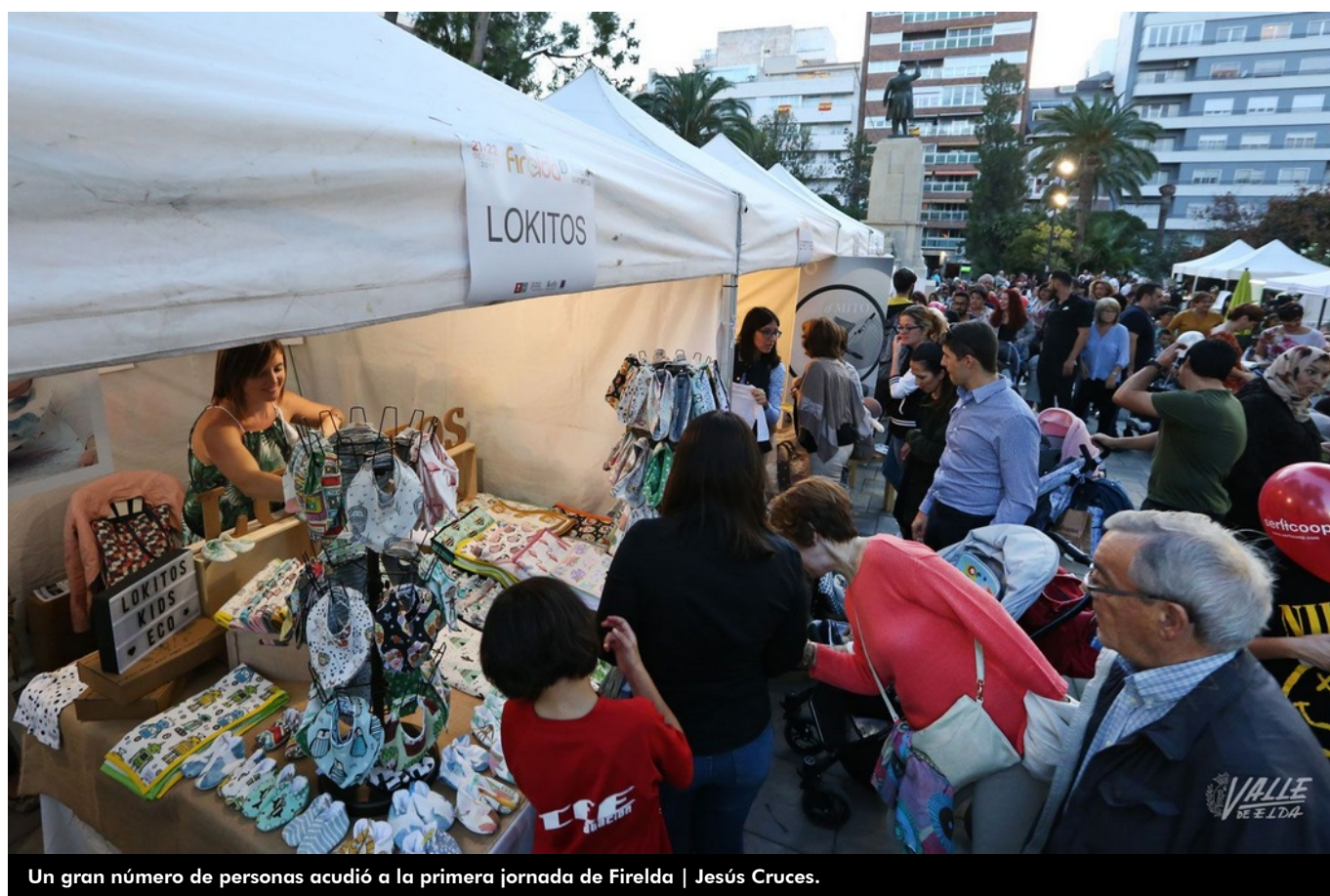
Un gran número de personas acudió a la primera jornada de Firelda | Jesús Cruces.

La Plaza Castelar vuelve a ser un fin de semana más el punto de encuentro de miles de personas gracias a Firelda, la feria del comercio local de la ciudad, que ha celebrado este año su quinta edición. Esta es una actividad organizada por el Ayuntamiento de Elda, a través de la Concejalía de Comercio, con el objetivo de fomentar las compras en la localidad. Cuenta con 59 expositores de la ciudad que desean dar a conocer sus productos a buenos precios . Se espera que entre la jornada de ayer y la de hoy miles de personas asistan al céntrico jardín para disfrutar de la amplia oferta de Firelda.