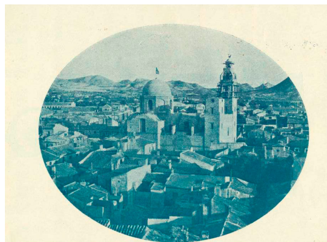
Vista de la iglesia de Santa Ana en 1944, donde tuvo lugar la bendición de banderas un 17 de septiembre.

Aquella ceremonia, como no podía ser de otra forma, tuvo lugar en el templo de Santa Ana , sacralizado e inaugurado tan solo 10 día antes. Allí, ante la Virgen de la Salud y el Cristo del Buen Suceso instalados en su majestuoso trono, las banderas de estas cinco comparsas fundadoras fueran bendecidas. Ceremonia seguida del nombramiento de capitanes y abanderadas para las próximas fiestas de San Antón que se celebrarían los días 20, 21 y 22 de enero de 1945 ; disparándose a continuación el alardo de arcabucería. Aquel mismo día 17 de septiembre de 1944 arrancaban oficialmente las Fiestas de Moros y Cristianos de Elda . ¡Hoy hace 75 años!