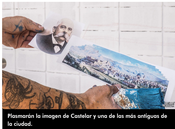
Plasmarán la imagen de Castelar y una de las más antiguas de la ciudad.

con este nuevo mural y dotando de más iluminación a la zona.