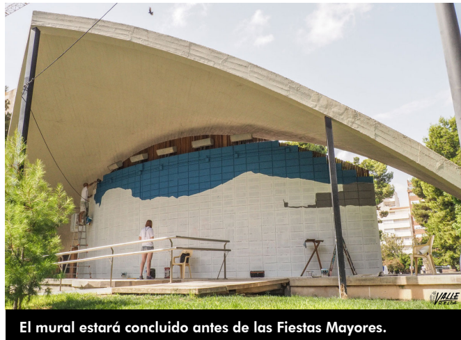
El mural estará concluido antes de las Fiestas Mayores.

Comenzaron ayer a trabajar y el diseño estará concluido antes de las Fiestas Mayores.