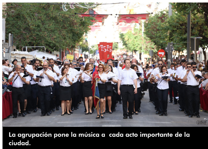
La agrupación pone la música a cada acto importante de la ciudad.

También ha adelantado el presidente de la entidad que de cara a las Fiestas Mayores están valorando cómo hacer el concierto tradicional de septiembre, pero cumpliendo con todas las medidas. Podría ser en la Plaza Castelar o en el Teatro Castelar, aunque este aspecto todavía está sin cerrarse.