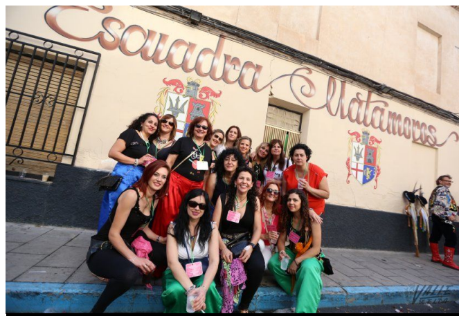
Un grupo de 14 amigas de Calasparra disfrutaron en Elda de una particular despedida de soltera | Jesús Cruces.

Este grupo de amigas llegó a Elda el sábado por la mañana y se marchó en la noche de ayer, unas 36 horas en las que pudieron disfrutar de todos los actos y tradiciones eldenses como unas más, pues Cabarro afirma que "el cuartelillo de la escuadra Matamoros nos ha recibido con los brazos abiertos, incluso nos han dejado ropa festera para que podamos integrarnos al máximo en la fiesta, no podría pedir más".