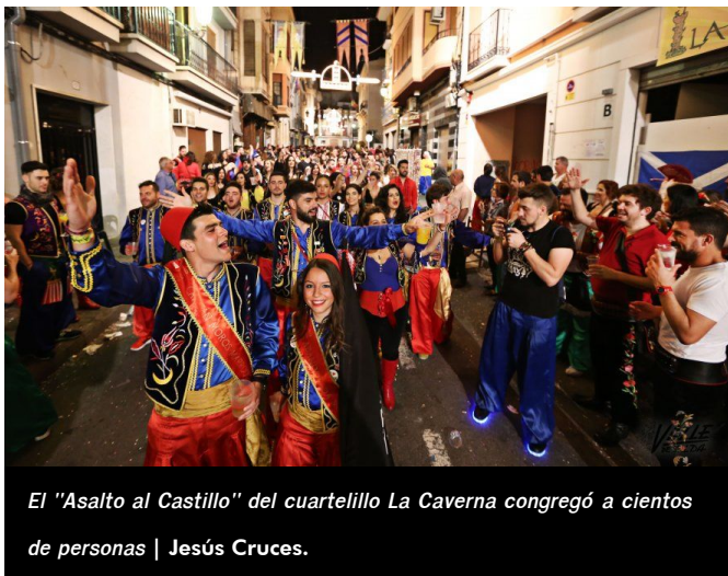
El "Asalto al Castillo" del cuartelillo La Caverna congregó a cientos de personas

Un ejemplo fue el cuartelillo "La Caverna", que acompañados por cientos de amigos, conocidos e invitados realizaron su ya tradicional pasacalles desde su sede, situada en la calle Príncipe de Asturias, hasta el Castillo de Embajadas. Bajo el título "Asalto al Castillo" fueron avanzado en esta singular actividad en la que contaban, además de con una banda, con su estandarte y con sus propios capitán y abanderada. En su recorrido recrearon las Entradas Mora y Cristiana y ya a las puertas del Castillo, el Idella y A San Antón .