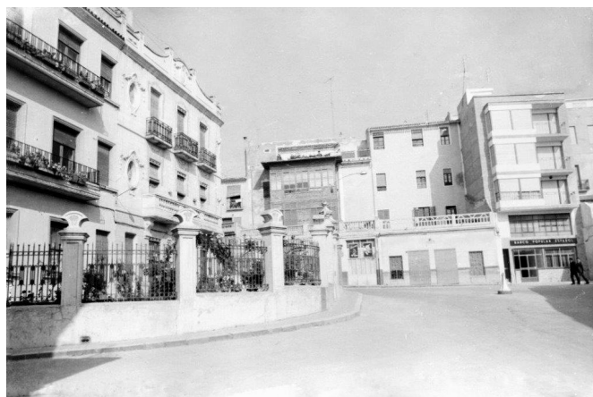
La casa supone el arranque de la calle Gabriel Payá | José Esteve.

estaban las viviendas de Nicolás Muñoz y de Eliseo el Pintat y al final la de la Pichona y el huerto del Roig el Carnisser .