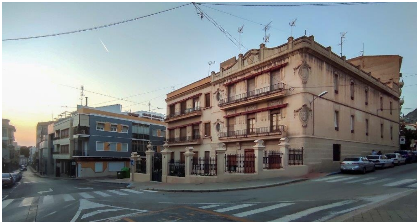
La conocida como casa de los Villaplana es todo un referente en Petrer