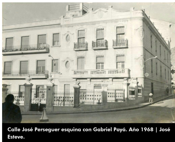
Calle José Perseguer esquina con Gabriel Payá. Año 1968