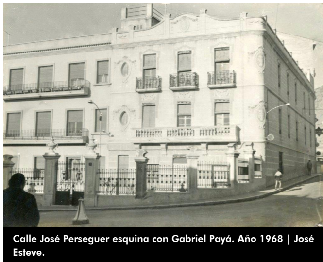
Calle José Perseguer esquina con Gabriel Payá. Año 1968