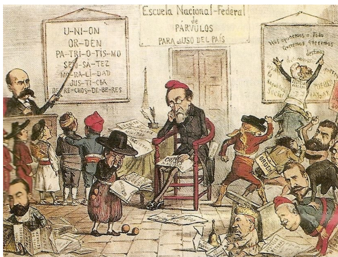
Caricatura política en la revista satírica "La Flaca" en la que aparece Castelar como maestro instructor de los alumnos regionalistas en los necesarios principios patrios.

El día 7 de septiembre de 1873, día de su 41 cumpleaños, Emilio Castelar fue investido por las Cortes como presidente del Poder Ejecutivo, recibiendo el apoyo de los diputados de la derecha republicana y del centro derecha de Salmerón, obteniendo 133 votos frente a los 67 conseguidos por el republicano federalista Pi y Margall.