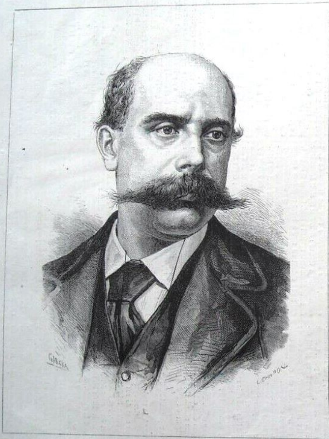
D. EMILIO CASTELAR, ex président de la République espagnole.