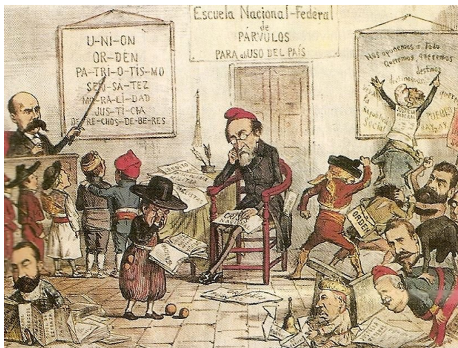
Caricatura política en la revista satírica "La Flaca" en la que aparece Castelar como maestro instructor de los alumnos regionalistas en los necesarios principios patrios.

El día 7 de septiembre de 1873, día de su 41 cumpleaños, Emilio Castelar fue investido por las Cortes como presidente del Poder Ejecutivo, recibiendo el apoyo de los diputados de la derecha republicana y del centro derecha de Salmerón, obteniendo 133 votos frente a los 67 conseguidos por el republicano federalista Pi y Margall.