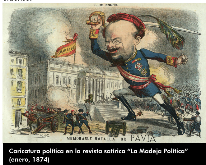
Caricatura política en la revista satírica "La Madeja Política" (enero, 1874)

plaza de la Candelaria, pero no podemos negar sus propias palabras, fiel reflejo de su sentimiento hasta el final de sus días, cuando al referirse a Elda lo hacía diciendo "Mi pueblo". Por tanto, no será este cronista quién niegue tal sentimiento de paisanaje eldense a tan ilustre personaje, pues por la misma norma varios cientos de eldenses pasarían ipso facto a ser alicantinos por haber visto los primeros rayos de sol en el Hospital General de Alicante; por no hablar de aquellos miles de eldenses que se sienten como tales aun habiendo nacido en diferentes poblaciones de Alicante, Albacete, Murcia, Granada, etcétera. Pues ya lo dice el refrán: "Uno no es de donde nace, sino de donde paca". Por tanto, ¡Allá con su conciencia, los defensores de la pureza de sangre eldense!