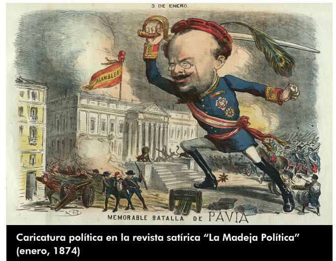
Caricatura política en la revista satírica "La Madeja Política" (enero, 1874)

plaza de la Candelaria, pero no podemos negar sus propias palabras, fiel reflejo de su sentimiento hasta el final de sus días, cuando al referirse a Elda lo hacía diciendo "Mi pueblo". Por tanto, no será este cronista quién niegue tal sentimiento de paisanaje eldense a tan ilustre personaje, pues por la misma norma varios cientos de eldenses pasarían ipso facto a ser alicantinos por haber visto los primeros rayos de sol en el Hospital General de Alicante; por no hablar de aquellos miles de eldenses que se sienten como tales aun habiendo nacido en diferentes poblaciones de Alicante, Albacete, Murcia, Granada, etcétera. Pues ya lo dice el refrán: "Uno no es de donde nace, sino de donde paca". Por tanto, ¡Allá con su conciencia, los defensores de la pureza de sangre eldense!