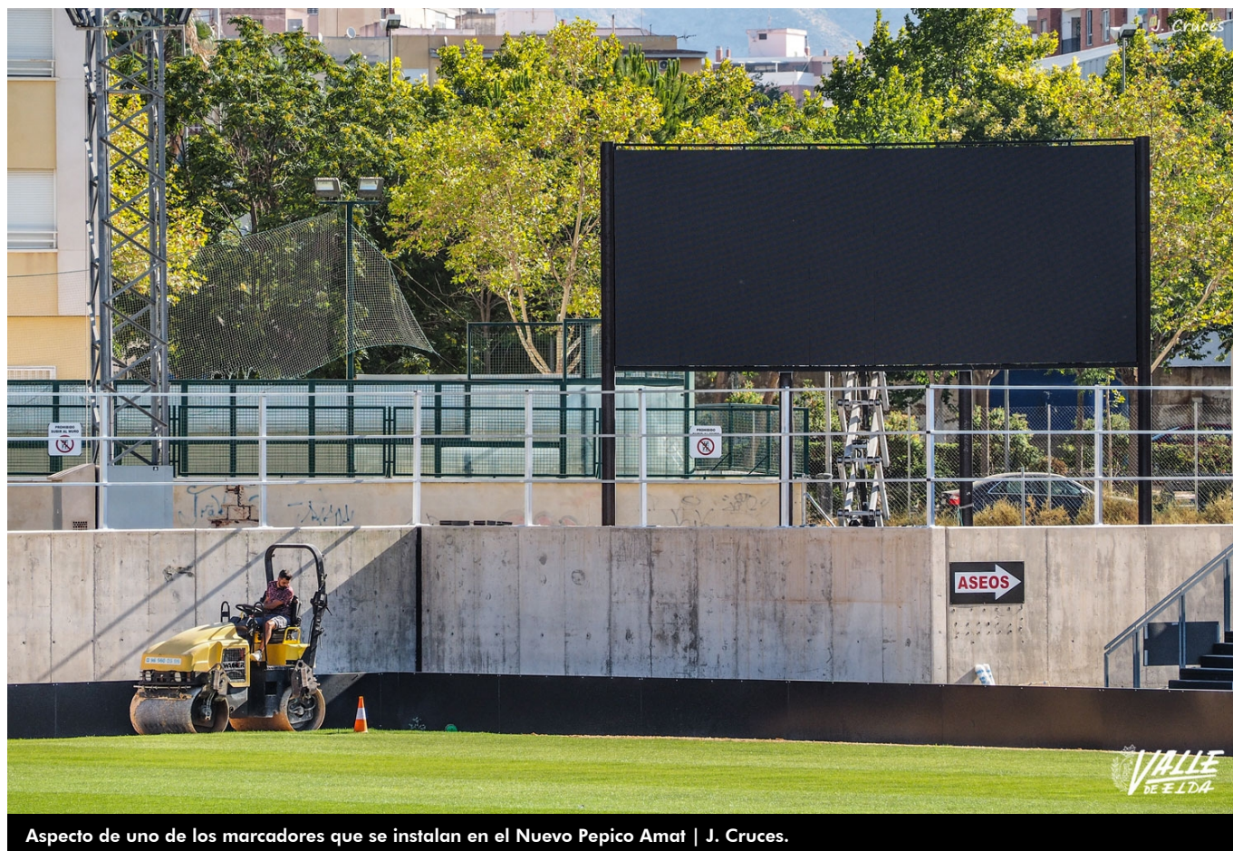
Aspecto de uno de los marcadores que se instalan en el Nuevo Pepico Amat | J. Cruces.

El ascenso del Deportivo a Segunda División está trayendo una serie de mejoras al Nuevo Pepico Amat de propiedad municipal aunque gestionado por el club azulgrana.