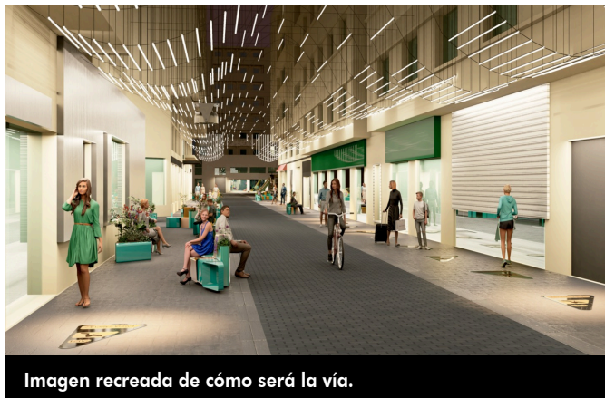
Imagen recreada de cómo será la vía.

como de la nueva iluminación LED que se dispondrá en el vial de este vial, destinado a convertirlo en un referente urbano de la ciudad que destaque el valor de su historia y sirva como eje dinamizador del comercio local.