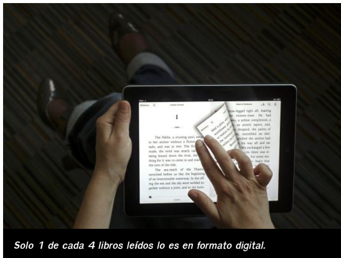
Solo 1 de cada 4 libros leídos lo es en formato digital.

Un retrato que se completa señalando que el peso del libro en papel crece por segundo año consecutivo tras varios de franco retroceso, representando un 72% del total de publicados, en tanto que el digital alcanza más de un 26%. Además de los libros de texto, en primer lugar, los subsectores de Ciencia y Tecnología y de Literatura infantil y juvenil son los únicos que crecen en el sector. Predominando en la oferta las primeras ediciones, con apenas un 2,4% el total de reediciones.