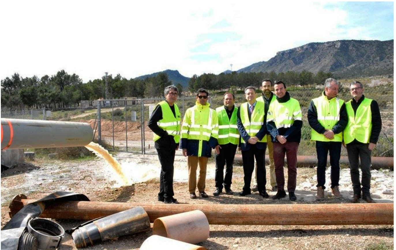
El equipo de gobierno visitando los pozos en imagen de archivo.