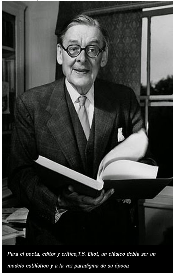
Para el poeta, editor y crítico, T.S. Eliot, un clásico debía ser un modelo estilístico y a la vez paradigma de su época

¿Qué opinas tú, lector, -mon semblable, -mon frère! ?