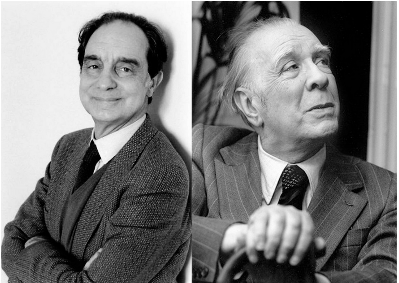
Italo Calvino Y Jorge Luis Borges reflexionaron en profundidad sobre los clásicos

“Clásico no es un libro (lo repito) que necesariamente posee tales o cuales méritos; es un libro que las generaciones de los hombres, urgidas por diversas razones, leen con previo fervor y con una misteriosa lealtad”