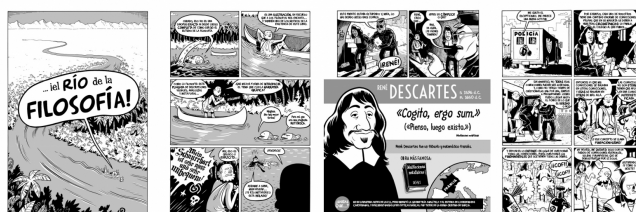
Varias páginas de este divertido y sustancioso cómic.

pensamiento occidental . Valioso por su capacidad para transmitir un legado tan vasto, orientando, estimulando, enseñando y entreteniendo a la vez a los lectores jóvenes que por primera vez accedan a él. E inusual por su planteamiento cercano y accesible para asimilar ideas y teorías tan aparentemente extrañas y sin embargo tan próximas a nuestras preocupaciones cotidianas desde siempre. Y sirviéndose además de unas ilustraciones gráficas que van hilando y amenizando todo el relato.