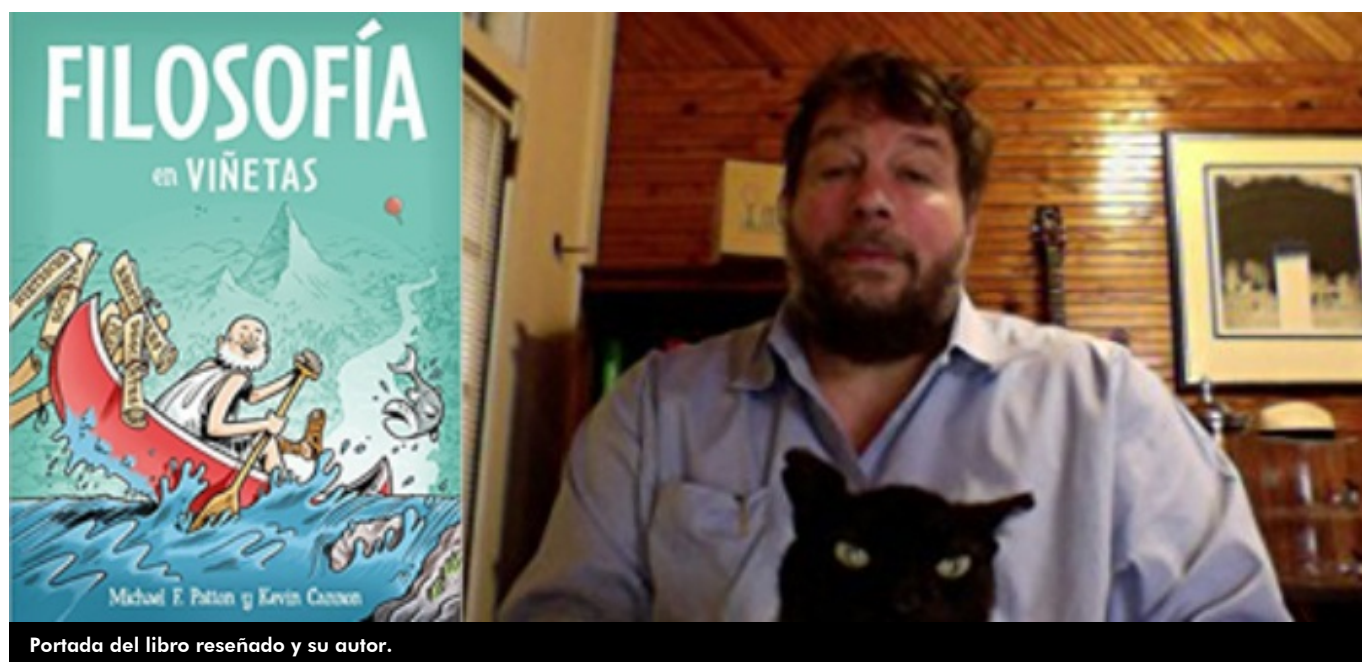
Portada del libro reseñado y su autor.

Va para cinco años que se implantó la LOMCE, esa ley educativa impuesta pese a la desaprobación de los docentes y con la total oposición de los partidos que se sentaban entonces frente al gobierno del PP en el Parlamento, quienes anunciaron a bombo y platillo que en cuanto pudiesen la derogarían sin miramiento alguno. Hoy, cuando esa oposición suma una mayoría suficiente para como poco retocarla, ni siquiera se han sentado para ver por dónde empiezan a desmontar tamaño entuerto. Entre las retrógradas medidas que se tomaron, una de las más lacerantes fue sin duda la supresión de la asignatura de Historia de la Filosofía como troncal y por tanto obligatoria para todos los estudiantes de 2º de Bachillerato . Dicen ahora que se arrepienten de la supresión pero nada ni nadie se mueve.