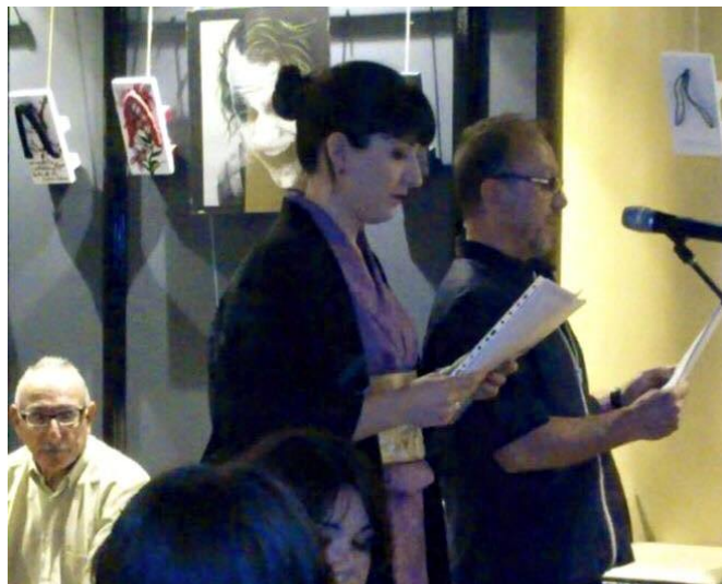
Presentación de las getas japonesas pintadas de la quincena anterior, en abril

Como siempre, un elenco de actividades variadas y sustanciosas y, como viene siendo norma con cada nueva quincena, un paso más para ampliar el ámbito de sus participantes, en este caso a los estudiantes de instituto. El afianzamiento de este colectivo, y de estas quincenas, en el panorama cultural de la ciudad es ya incontestable. Y el nivel de sus propuestas también. Además de todo lo mencionado, que en sí mismo ya es atractivo, hay que destacar el cartel que anuncia la quincena, impactante y sugerente a la vez, realizado por el artista Adrián Chinchilla .