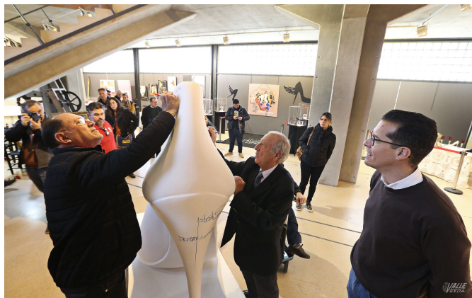
Los personajes ligados al Museo del Calzado firman en un zapato gigante