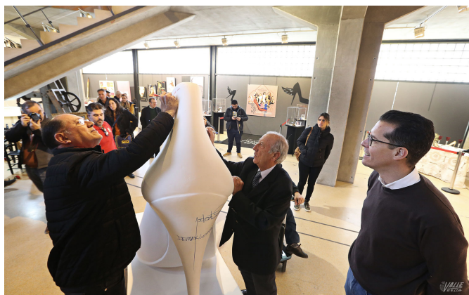
Los personajes ligados al Museo del Calzado firman en un zapato gigante | Jesús Cruces.