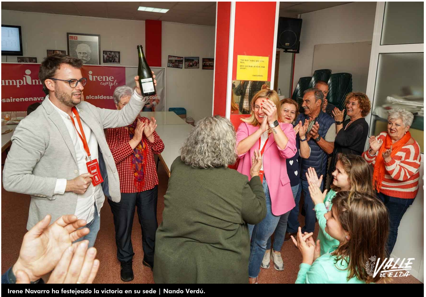
Irene Navarro ha festejado la victoria en su sede | Nando Verdú.

Irene Navarro volverá a ser la alcaldesa de Petrer. Así lo han elegido los 19.186 petrerís que han votado en estas elecciones municipales. Los socialistas han sacado mayoría absoluta con un total de 11 concejales, dos menos que en la anterior legislatura. Por otra parte, el Partido Popular liderado por Paco Ponce tendrá ocho concejales, tres más que estos últimos cuatro años. Vox ha sacado un concejal, al igual que Acord per Guanyar (Esquerra Unida y Compromís), mientras que Ciudadanos y Podemos no han conseguido sacar ningún escaño.