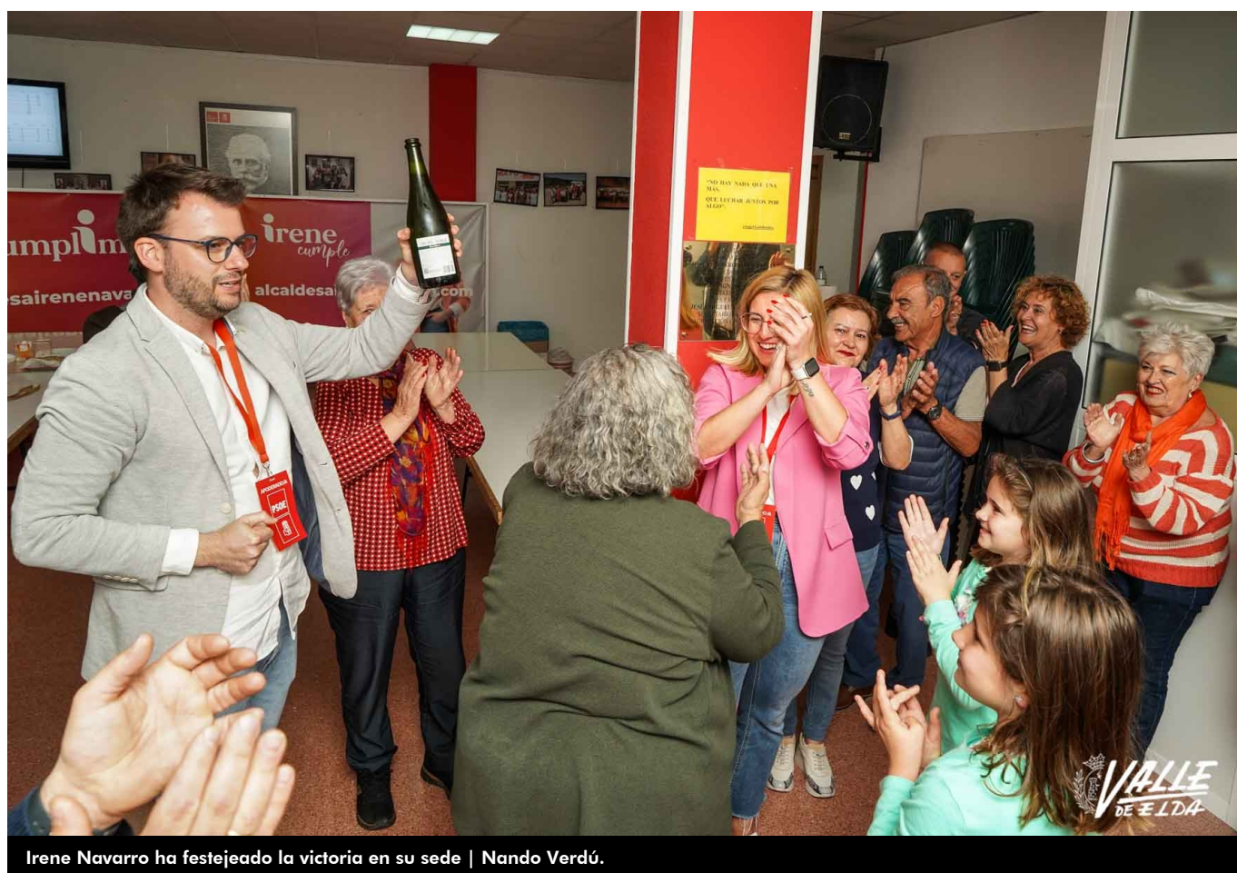
Irene Navarro ha festejado la victoria en su sede | Nando Verdú.

Irene Navarro volverá a ser la alcaldesa de Petrer. Así lo han elegido los 19.186 petrerís que han votado en estas elecciones municipales. Los socialistas han sacado mayoría absoluta con un total de 11 concejales, dos menos que en la anterior legislatura. Por otra parte, el Partido Popular liderado por Paco Ponce tendrá ocho concejales, tres más que estos últimos cuatro años. Vox ha sacado un concejal, al igual que Acord per Guanyar (Esquerra Unida y Compromís), mientras que Ciudadanos y Podemos no han conseguido sacar ningún escaño.