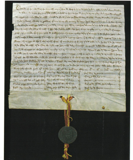
Documento original de donación del señorío de Elda a Guillén el Alemán, fechado en Murcia el 15 de abril de 1244. Este documento, conservado en el Archivo Histórico Nacional, se convierte en el primer documento medieval en el que aparece citada Elda y por tanto una pieza de excepcional interés para nuestra historia.