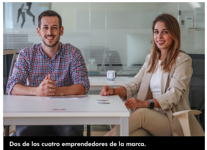
Dos de los cuatro emprendedores de la marca.

El proyecto consiste en la puesta en marcha de un cultivo mediante tanques basado en sistemas de recirculación en tierra firma de algas autóctonas del Mar Mediterráneo previamente detectadas e identificadas.