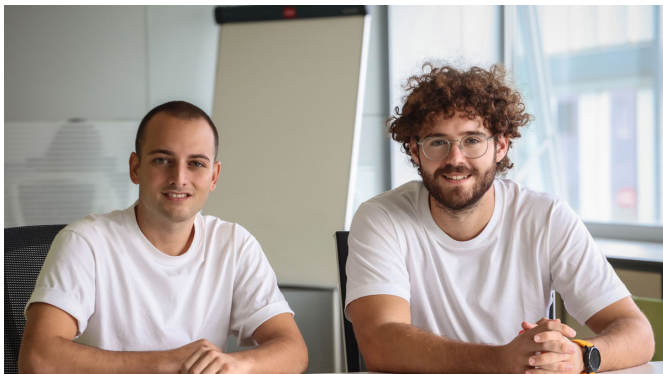
Dos de los emprendedores del proyecto.

gestión del dinero tanto de entidades públicas como privadas; y ser el enlace entre las nuevas generaciones y el pequeño comercio.