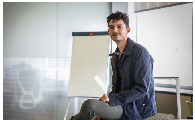
Uno de los responsables de la marca.

FreeShakes es un proyecto que desarrolla productos para intolerantes a la fructosa, con el objetivo principal de mejorar la calidad de vida a través de una gama de productos sin fructosa, mínimamente procesados y hechos a partir de frutas y verduras. Todo ello gracias a la tecnología que están desarrollando y que pretenden patentar.