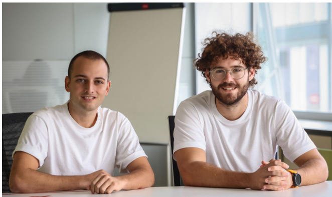
Dos de los emprendedores del proyecto.

gestión del dinero tanto de entidades públicas como privadas; y ser el enlace entre las nuevas generaciones y el pequeño comercio.