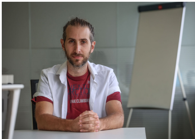
Uno de los responsables de la marca.

Festablas es una empresa pionera en conectar compañías de teatro y festivales. Hasta la fecha la mayoría de las inscripciones para un festival de teatro se hace a través de correo ordinario. Este proyecto busca digitalizar las inscripciones en los festivales de teatro de la misma forma que se ha hecho durante los últimos años en el cine. Sustituir el envío postal por el envío de links con toda la información necesaria a través de un servidor privado.