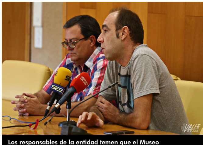
Los responsables de la entidad temen que el Museo

atender las necesidades de gestión y funcionamiento del Museo Etnológico, ya que necesitan "que personal técnico se encargue de estas funciones, así como ayuda para restaurar piezas pues existe un problema de carcoma para seguir montando el Museo, ya que desde su traslado hace dos años muchos elementos siguen almacenados sin poder exhibirse".