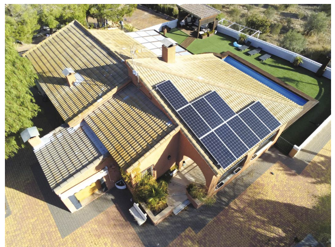
Instalación de autoconsumo doméstico en Elda.

De este modo, todos aquellos que pretendan orientar su consumo energético hacia un modelo renovable y respetuoso con el medio ambiente, pueden concertar una visita con su equipo técnico y formar parte del cambio gracias a su propia instalación de autoconsumo fotovoltaico.