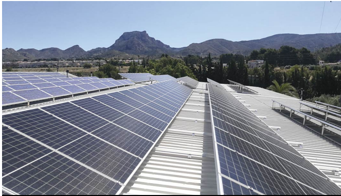
Instalaciones de autoconsumo industrial en Petrer.

Con un equipo multidisciplinar de profesionales, donde confluyen perfiles de diferentes especialidades (ingenieros, economistas o abogados, entre otros), Ampertec Energy desarrolla sus proyectos fotovoltaicos "llave en mano", gestionando desde su diseño hasta su puesta en marcha y legalización.