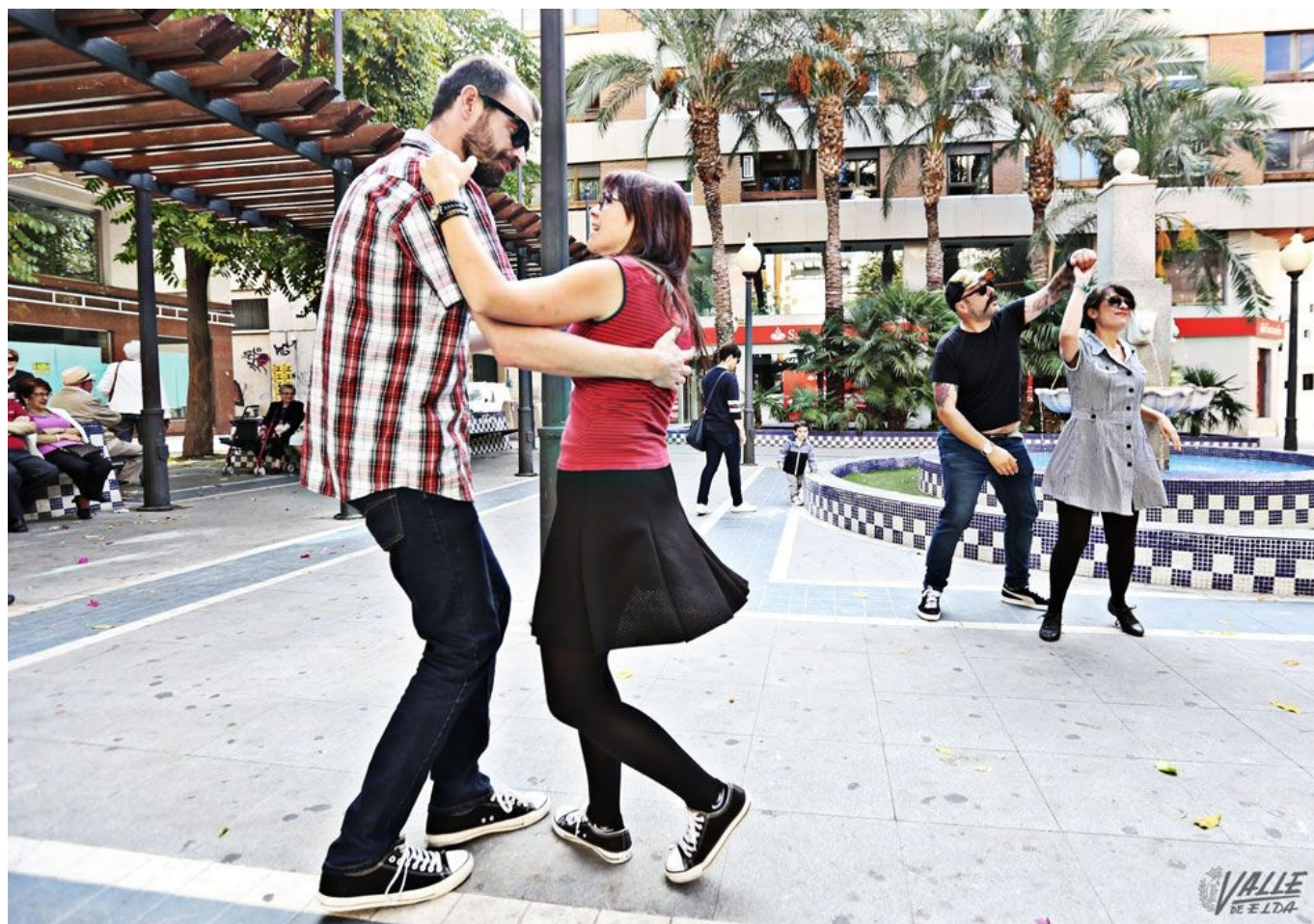
Los miembros del grupo bailan en espacios públicos para dar a conocer el Lindy hop | Jesús Cruces.

Un altavoz y ganas de bailar, eso es lo único que necesitan los aficionados al Lindy Hop, una variedad del swing, de Elda, para llenar de vida y buen ambiente los espacios más emblemáticos de la ciudad como las plazas Sagasta, Castelar y Mayor. Muchos eldenses se han encontrado a lo largo de más de dos años y medio con un este grupo de apasionados bailarines, el grupo Swing Wolf, quienes realizan sin plazo ni espacio fijo sus "clandestinos" , encuentros en los que lo único que importa es divertirse y animar a los viandantes a pasar un rato agradable.