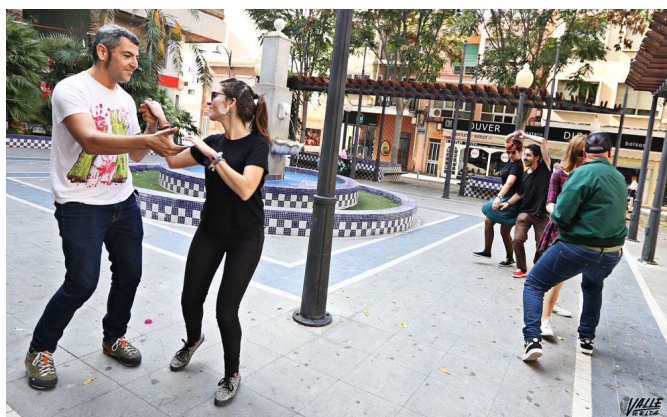
Imagen de su última salida en la Plaza Sagasta, el pasado domingo

Aunque Vera admite que "a la gente aún le da reparo, poco a poco se van animando más. Para ello hacemos talleres, en los que enseñamos a bailar y la gente suele participar" .