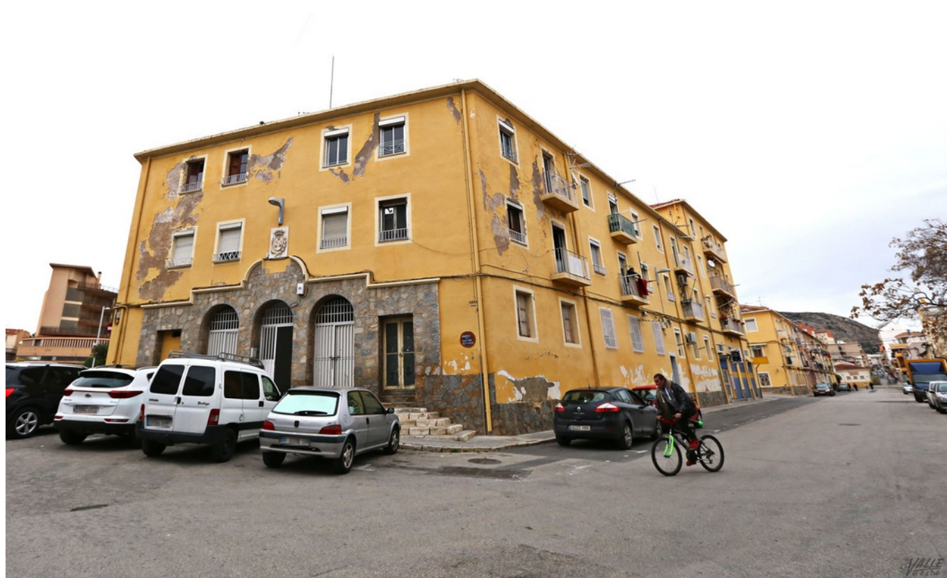
Los bloques de viviendas se encuentran en el barrio Virgen de la Cabeza