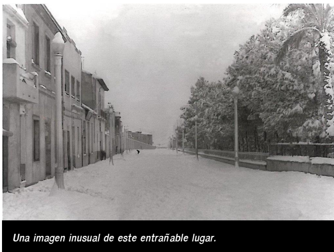
Una imagen inusual de este entrañable lugar.

Esta vía urbana se ha conocido a lo largo de su dilatada historia con diversos nombres y en la mayoría de las ocasiones las alteraciones en el callejero se han debido a cambios políticos. Así, en 1927, el alcalde Luis Villaplana Reig, expuso que para celebrar los 25 años en el trono se rotulara como Alfonso XIII "al paseo avenida que se está construyendo en la prolongación de la calle Alfonso XII, camino llamado de los Pasos". Alfonso XII se denominaba a la actual calle José Perseguer, mientras que Alfonso XIII sería la actual Explanada desde la actual calle Leopoldo Pardines hasta el patio del colegio Primo de Rivera, según un plano de dicho colegio de 1929. Al parecer, y según este plano, la Explanada estaba dividida en dos tramos: Alfonso XIII y el Camino de los Pasos, nombre que recibía desde el patio del colegio hacia Salinetas. En lo que en la actualidad es el patio interior de este centro escolar se hallaban antiguamente els sequers de la pansa , donde la uva se secaba y se manipulaba hasta transformarla en pasas.