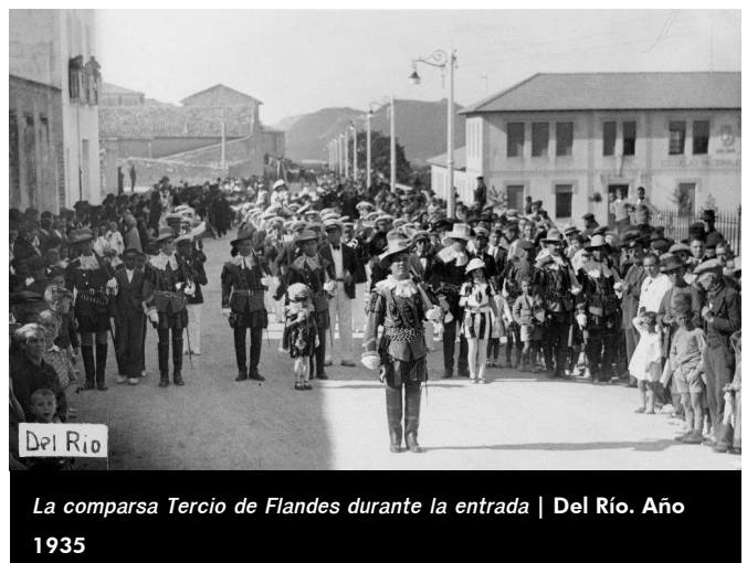
La comparsa Tercio de Flandes durante la entrada Año 1935

En la primera sesión plenaria del gobierno provisional de la República, celebrada por el Ayuntamiento de Petrer el 15 de abril de 1931, entre los acuerdos que se tomaron se decidió cambiar la nomenclatura de varias calles y entre ellas la de Alfonso XIII que pasó a denominarse calle del Capitán Galán, en honor a uno de los mártires de Jaca. Resulta muy significativa la total contraposición del cambio de dos calles, ya que pasaron de llevar el nombre de dos monarcas: Alfonso XII y Alfonso XIII a llevar el nombre de dos dirigentes del levantamiento republicano que tuvo lugar el 12 de diciembre de 1930 en la ciudad oscense de Jaca, por el cual los capitanes Ángel García Hernández y Fermín Galán fueron condenados a muerte y fusilados. Las calles continuas que llevaban los nombres de los dos últimos reyes de antes del advenimiento de la Segunda República pasaban ahora a denominarse con los apelativo de estos militares que dirigieron el pronunciamiento militar contra la monarquía de Alfonso XIII durante la «Dictablanda» del general Berenguer. Aunque fue sofocada y fueron fusilados los capitanes Fermín Galán Rodríguez y Ángel García Hernández sus efectos se dejaron sentir en la proclamación de la Segunda República Española cuatro meses después.