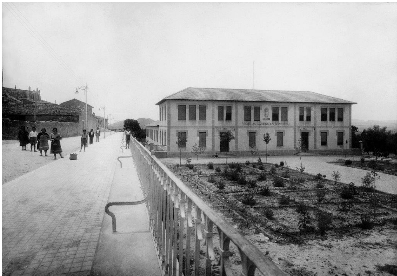
La Explanada y las escuelas nacionales graduadas Primo de Rivera. Año 1935.

En esta ocasi3n hablaremos de los nombres de un lugar que ha sido muy importante en la vida de los habitantes de Petrer: l'Explanà . Popularmente, siempre se conoci3 como el Camí dels Passos porque en el mismo estaban las estaciones del vía crucis . En este lugar se localizaba el fossar de 3poca medieval, situado a los pies de la colina donde en el siglo XVII se construiría la ermita de San Bonifacio (hoy carrer Nou), quedando 3ste por encima de las huertas que ocupaban las escuelas. Hay referencias documentales a este top3nimo en el libro de giradora de 1655 y tambi3n evidencias arqueol3gicas, que constatan la existencia de un cementerio en el que se enterraría a la