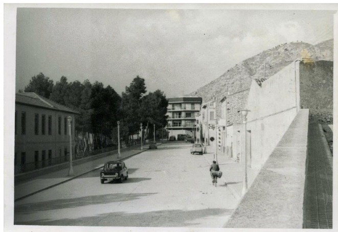
La Explanada vista desde la calle Calvario | José Esteve.

Al menos desde el año 1930 en esta calle hubo una fuente y, en un principio, estuvo situada en el lado del paseo que daba encima del patio de recreo del colegio Primo de Rivera, tenía el pie de hierro, después fue trasladada al otro lado de la calle, estaba empotrada en el muro y tenía una forma muy similar a la que había en las gradas de la iglesia. También en 1930 se construyó el muro en forma de banco del Camino de los Pasos y Alfonso XIII, por el que hemos caminado tantas veces de pequeños y, tres años más tarde, se inició la construcción del muro inferior del colegio, por el peligro que su inexistencia comportaba para los escolares.