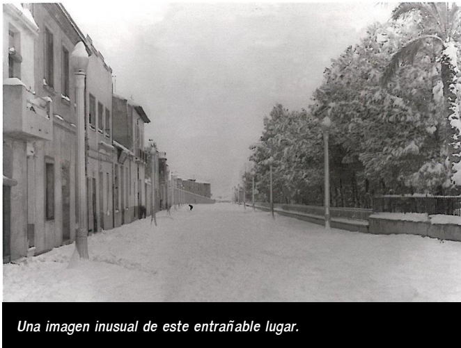
Una imagen inusual de este entrañable lugar.

Esta vía urbana se ha conocido a lo largo de su dilatada historia con diversos nombres y en la mayoría de las ocasiones las alteraciones en el callejero se han debido a cambios políticos. Así, en 1927, el alcalde Luis Villaplana Reig, expuso que para celebrar los 25 años en el trono se rotulara como Alfonso XIII "al paseo avenida que se está construyendo en la prolongación de la calle Alfonso XII, camino llamado de los Pasos". Alfonso XII se denominaba a la actual calle José Perseguer, mientras que Alfonso XIII sería la actual Explanada desde la actual calle Leopoldo Pardines hasta el patio del colegio Primo de Rivera, según un plano de dicho colegio de 1929. Al parecer, y según este plano, la Explanada estaba dividida en dos tramos: Alfonso XIII y el Camino de los Pasos, nombre que recibía desde el patio del colegio hacia Salinetas. En lo que en la actualidad es el patio interior de este centro escolar se hallaban antiguamente els sequers de la pansa , donde la uva se secaba y se manipulaba hasta transformarla en pasas.