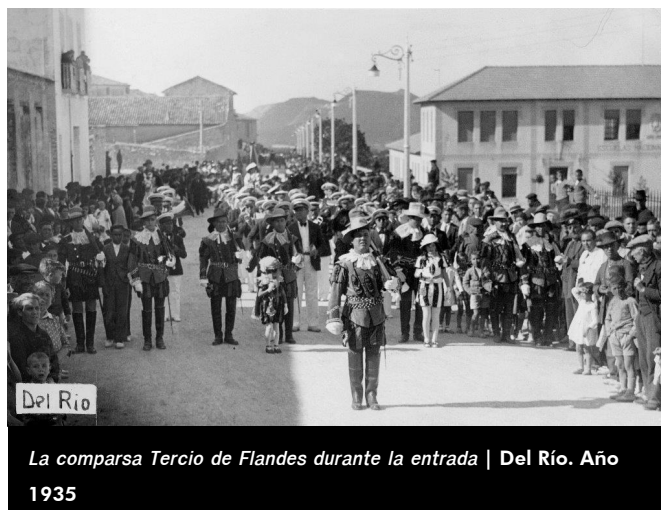
La comparsa Tercio de Flandes durante la entrada Año 1935

En la primera sesión plenaria del gobierno provisional de la República, celebrada por el Ayuntamiento de Petrer el 15 de abril de 1931, entre los acuerdos que se tomaron se decidió cambiar la nomenclatura de varias calles y entre ellas la de Alfonso XIII que pasó a denominarse calle del Capitán Galán, en honor a uno de los mártires de Jaca. Resulta muy significativa la total contraposición del cambio de dos calles, ya que pasaron de llevar el nombre de dos monarcas: Alfonso XII y Alfonso XIII a llevar el nombre de dos dirigentes del levantamiento republicano que tuvo lugar el 12 de diciembre de 1930 en la ciudad oscense de Jaca, por el cual los capitanes Ángel García Hernández y Fermín Galán fueron condenados a muerte y fusilados. Las calles continuas que llevaban los nombres de los dos últimos reyes de antes del advenimiento de la Segunda República pasaban ahora a denominarse con los apelativo de estos militares que dirigieron el pronunciamiento militar contra la monarquía de Alfonso XIII durante la «Dictablanda» del general Berenguer. Aunque fue sofocada y fueron fusilados los capitanes Fermín Galán Rodríguez y Ángel García Hernández sus efectos se dejaron sentir en la proclamación de la Segunda República Española cuatro meses después.