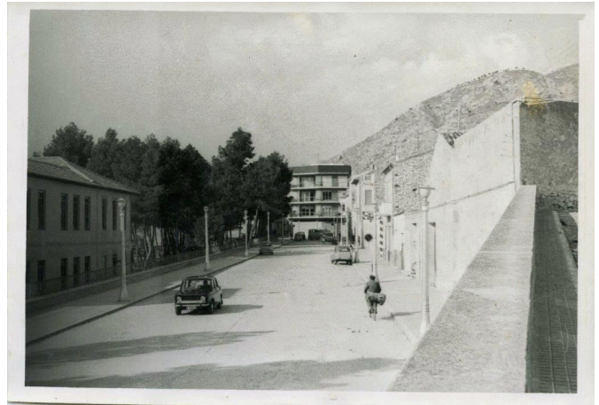
La Explanada vista desde la calle Calvario | José Esteve.

Al menos desde el año 1930 en esta calle hubo una fuente y, en un principio, estuvo situada en el lado del paseo que daba encima del patio de recreo del colegio Primo de Rivera, tenía el pie de hierro, después fue trasladada al otro lado de la calle, estaba empotrada en el muro y tenía una forma muy similar a la que había en las gradas de la iglesia. También en 1930 se construyó el muro en forma de banco del Camino de los Pasos y Alfonso XIII, por el que hemos caminado tantas veces de pequeños y, tres años más tarde, se inició la construcción del muro inferior del colegio, por el peligro que su inexistencia comportaba para los escolares.