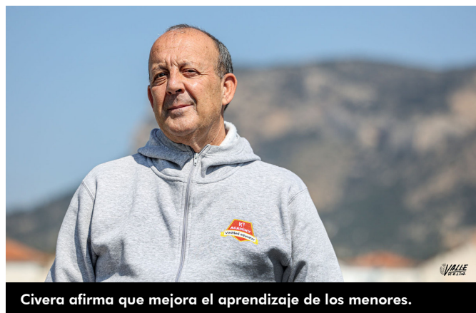
Civera afirma que mejora el aprendizaje de los menores.

Por otra parte, también ha preparado una colección de kahoots para los alumnos del curso de Acceso a mayores de 25 años de la UNED, docencia a la que se ha dedicado durante más de 30 años.