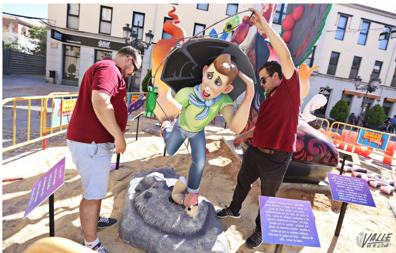
El ninot ha sufrido múltiples desperfectos | Jesús Cruces.

La Falla Oficial de Junta Central, situada en la Plaza de la Constitución, frente al Ayuntamiento, ha sufrido el robo de uno de sus ninots esta noche . La figura que representa a un eldense corriendo la traca ha aparecido en la calle Óscar Esplá, en el barrio Caliu, a primera hora de la mañana. La Policía Local ha devuelto la imagen a su monumento , no sin antes comprobar que tiene múltiples desperfectos, pues se le ha roto el brazo y tenía varios raspones .