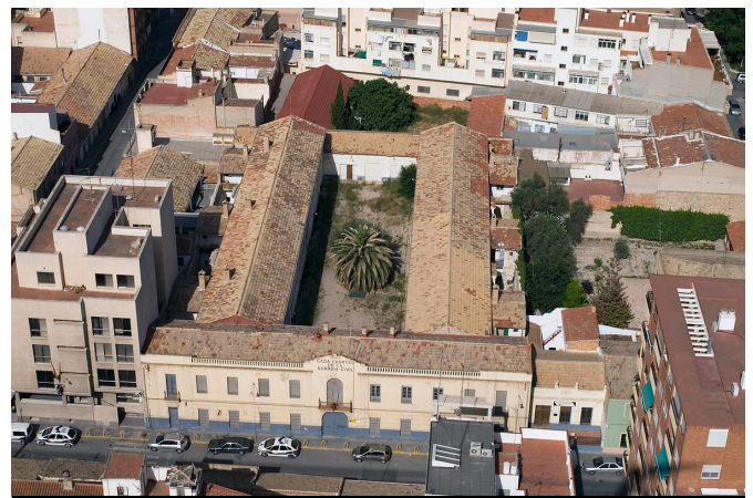
Imagen del cuartel de la Guardia Civil | José Miguel Lorenzo.

La estructura de Planes Generales no sirve como herramienta (lentos, complejos y poco reales). Hay que desarrollar proyectos sectoriales más precisos donde abordar el nuevo suelo industrial, nuevo vial de comunicación y crecimiento y la reordenación de Nueva Fraternidad. Eso permitirá debates y consensos más concretos y menos teóricos.