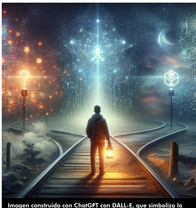
Imagen construida con ChatGPT con DALL-E, que simboliza la

Hoy se colocan electrodos en el cerebro para identificar las zonas o neuronas de las que proviene una anomalía al registrar la actividad de las neuronas individualmente y se puede ver cuales responde a estímulos. Se ha detectado a nivel individual la respuesta de neuronas y eso es un avance notable. Se habla del canal 52 y la neurona 2 denominada de Jennifer Aniston, por haber revelado un paciente que se activaba exclusivamente ante la foto de la actriz, pero cualquier foto de ella producía el mismo efecto, luego se trataba de un concepto, no de una excitación lumínica o en general visual. Se trata de que hay neuronas que responden a conceptos, según muestra Quian Quiroga del grupo de percepción del Hospital del Mar Research Institute e investigadores del MIT. Las neuronas del hipocampo responden a conceptos y relación entre ellos que son la base de nuestras experiencias.