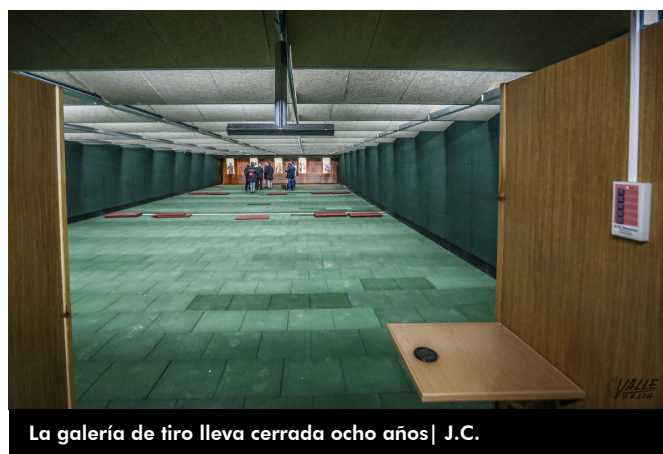
La galería de tiro lleva cerrada ocho años | J.C.

Hasta ahora, la Policía Local de Elda realiza las sesiones de práctica de tiro obligatoria en espacios como el conocido Tiro Pichón , a las faldas del monte Bolón.