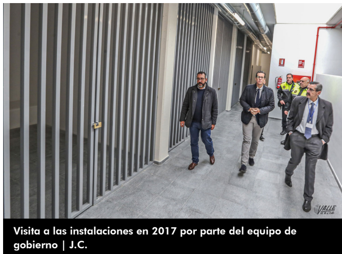
Visita a las instalaciones en 2017 por parte del equipo de gobierno