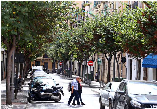
Gómez ha afirmado que espera renovar este contrato

en las podas". La empresa también se encargará de la recogida y gestión de los restos de todas las palmas, dátiles, flores , entre otros, los cuales se retirarán en la misma jornada en que se generen y conforme a la legislación vigente.