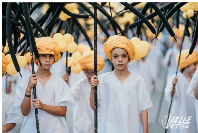
Los Musulmanes han dedicado su boato a su 75 aniversario | Germán Mezanza.

El bando moro lo han abierto por segundo año consecutivo los Musulmanes con motivo de la celebración de su 75 aniversario. Y por ello han recreado una fiesta de cumpleaños en el desierto, con sus palmeras en la cual no ha faltado elementos como la tarta, globos, confeti, música y diversión. Tras ellos, han desfilado Realistas, Huestes del Cadí y Marroquíes.