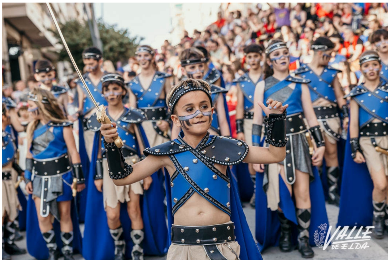
Los Cristianos han iniciado el desfile | Germán Mezanza.

Los más pequeños han tomado el mando de la fiesta, como cada viernes de Moros y Cristianos, con el Desfile Infantil. Miles de personas han acompañado a los menores durante todo el recorrido mientras estos llenaban las calles de color y alegría. Los dos boatos han llamado la atención, así como los espectaculares trajes de sus capitanías y, como siempre, el buen hacer de los pequeños festeros.