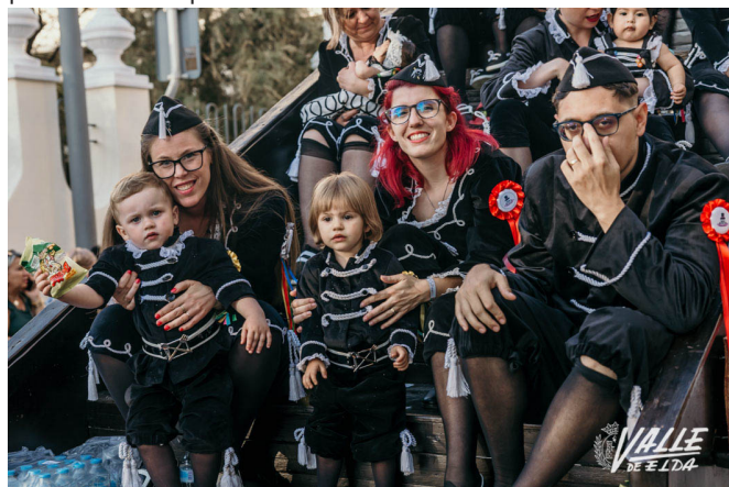
Los festeros más pequeños han salido en las carrozas | Germán Mezanza.

Al paso de las Capitanías se han tirado confetis, con los colores representativos de cada una de las comparsas, por diferentes partes del recorrido.