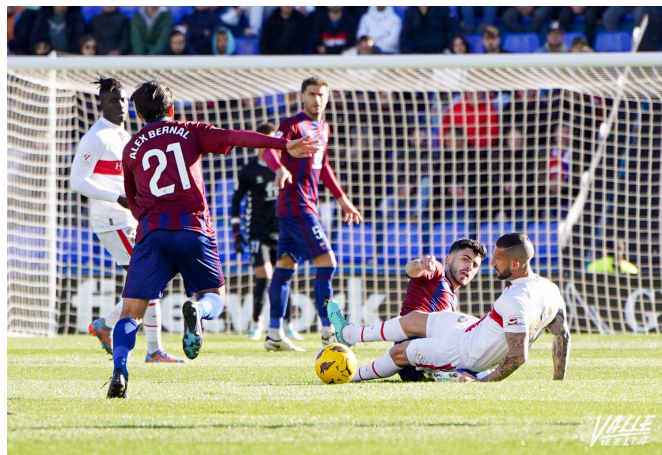
Eldense y Huesca no vieron puerta en su duelo liguero disputado en Elda.

El campeonato de Liga transita rumbo a su centenario, que se celebrará en la temporada 2028-29, mientras tanto, el histórico Deportivo Eldense, el club decano de la provincia de Alicante, continúa ampliando su leyenda.